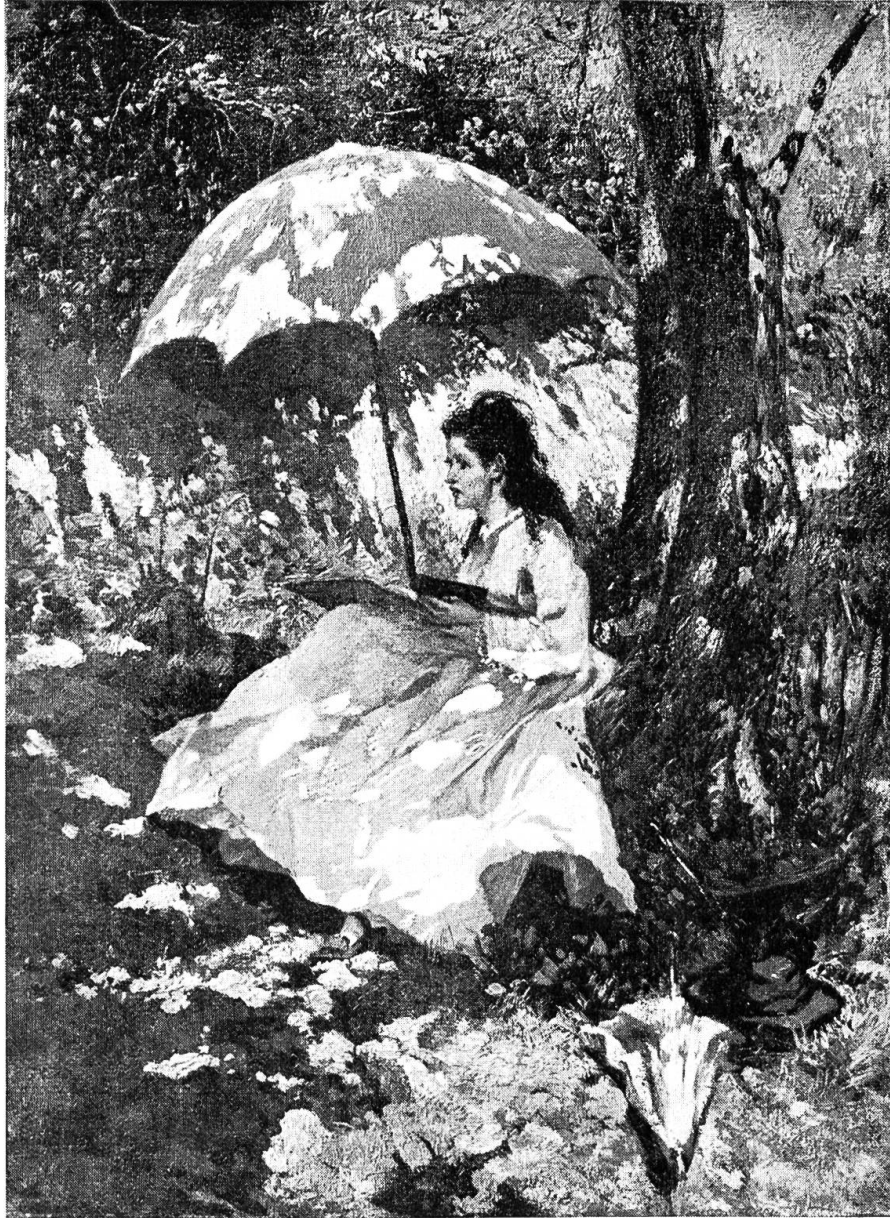
Frank Buchser: Im Sonnenschein.

Welt und biedermeierliches Verlangen nach dem beschränkten, wohligen Kreise in seiner unruhvollen Brust; in ewiger Unrast lassen sie ihn seinen Träumen und Wunschbildern nachjagen. Jenes Wort Fausts, es könnte der Kennspruch seines Lebens sein: