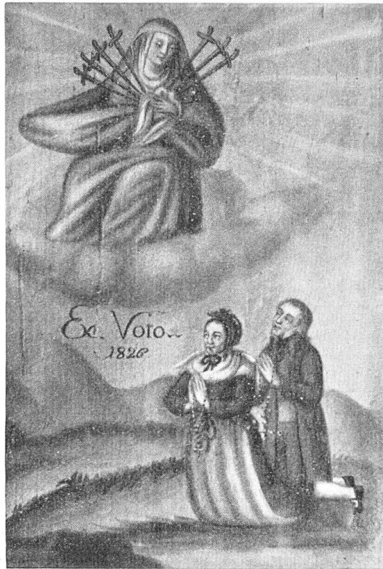
Votivtafel aus Mariastein.

Die grosse Bedeutung der Votive ist von der Wissenschaft in unsern Nachbarländern längst erkannt worden. Wichtige Einsichten und Ergebnisse für die Geschichte der Heiligenverehrung, der Gnadenstätten und Wallfahrtsorte sind aus ihnen gewonnen worden. Die Votivbilder insbesondere sind reiche, oft einzigartige und noch gar nicht ausgeschöpfte Quellen für die Kulturgeschichte und Volkskunde; für die Geschichte der Volkstracht z. B. geben sie sehr oft den einzigen dokumentarischen Beleg. Ebenso wertvoll sind sie als Zeugnisse volkstümlichen Kunstfleisses, und endlich interessiert den Forscher ihre altherwürdige Symbolsprache.