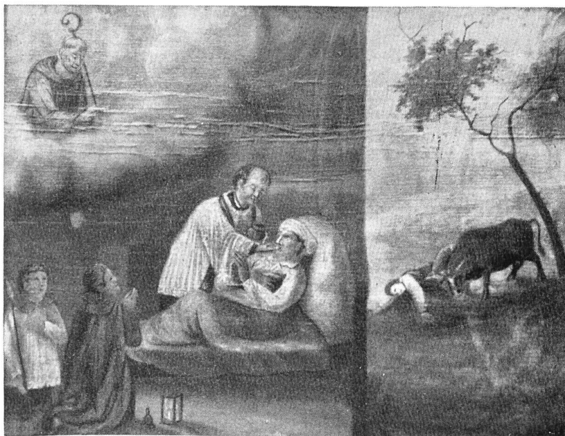
Votivtafel aus der St. Fridolinskapelle bei Breitenbach.

Sehr mannigfach sind die Gaben, die als Opfer und Weihegeschenke dargebracht werden. Wir treffen unbeholfene Gebilde aus Wachs und kunstvoll gezierte, mächtige Wachskerzen (Mariastein), naive Nachbildungen von Tieren und menschlichen Gliedern aus Holz und Eisen (Allerheiligen, Meltingen), Gaben aus Gold und Silber, bes. Herzen (Mariastein), Kleidungsstücke, Krücken, die von Geheilten am Gnadenort zurückgelassen wurden, vor allem aber Votivtafeln, auf welchen der Hergang des erlebten Wunders oft in naiver, drastischer Art dargestellt ist (Mariastein, Meltingen, Oberdorf etc.).