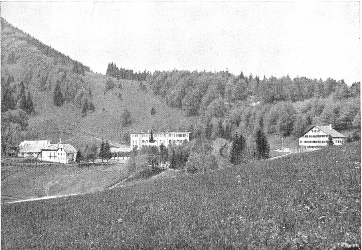
Ober-Balmberg, Kurhaus und Kinderheim.

So steht es in dem Briefe Carl Spittlers. Er war damals, als er mir diese Zeilen schrieb, 77 Jahre alt. Nun ist er schon lange tot; aber wer die Balmberge liebt, der liest gerne heute noch unter einer der weissen Kanzeln im Morgensonnenschein vom «Friedli, dem Kolderi», vom «Olympischen Frühling», oder wenn die Schatten um die Flühe lagern, suchen seine Augen Sonne in den farbigen «Schmetterlingen».