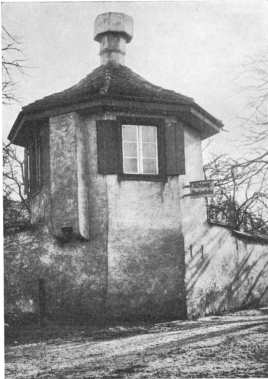
Muttenz. Gartenhäuschen beim „Hof“.

Barocke Bauteile sind noch an etwa 20 Häusern zu finden. Wirklich ein gut erhaltenes Dorf! So ist es auch nicht verwunderlich, dass wir zu 28 Gebäuden einen Stern setzen durften, was also besagen will, dass das betreffende Gebäude unter Denkmalschutz zu stellen sei.