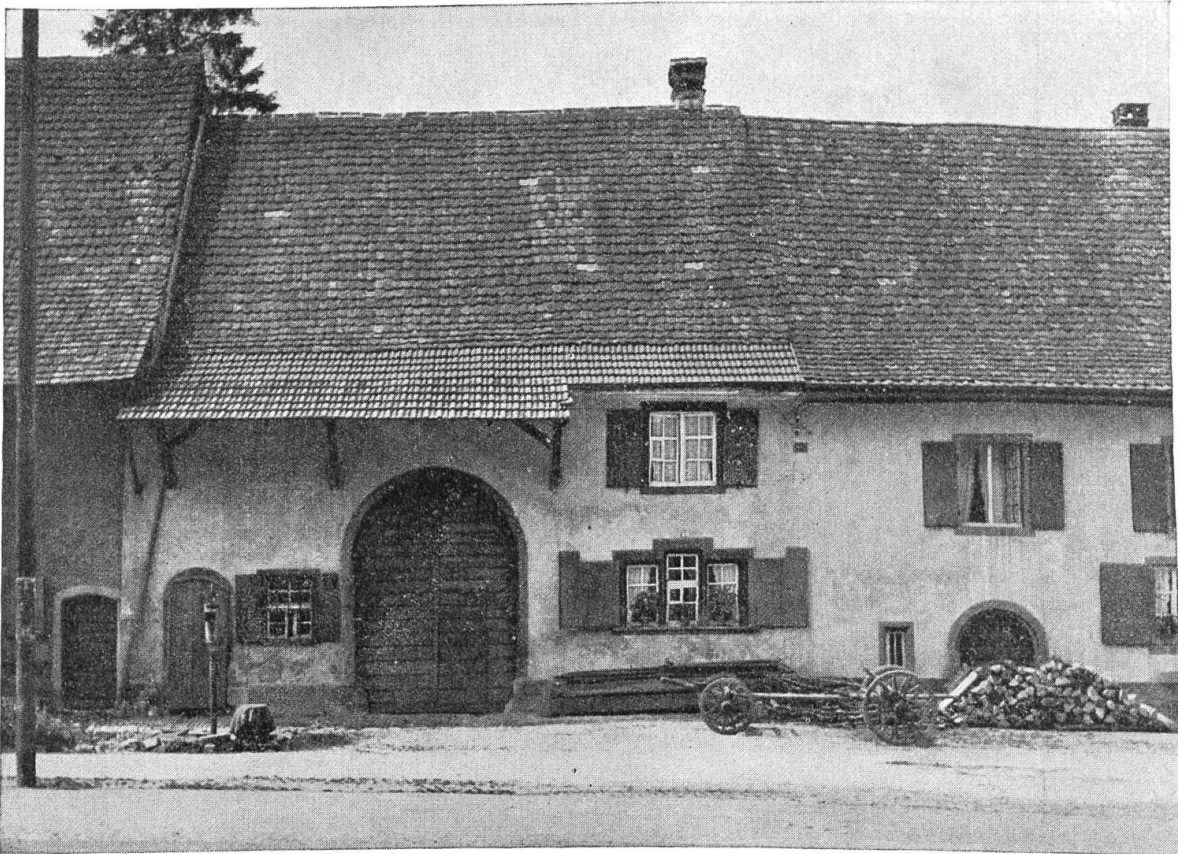
Muttenz. Gotisches Bauernhaus im Oberdorf.

Entwicklung zur Vorortsgemeinde von Basel begriffen ist. Glücklicherweise hat sich aber das neue Muttenz in angemessener Entfernung vom bäuerlichen entwickelt; die alten Gassen, Strassen und Häuser mit reizvollen Einzelheiten sind fast unverändert geblieben.