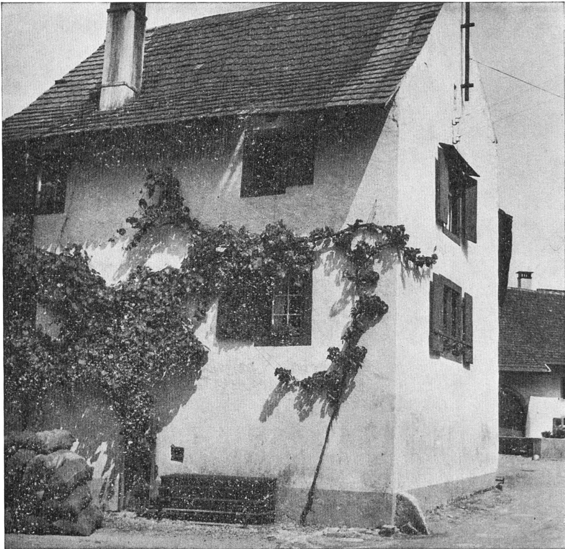
Muttenz. Rebenbekröntes Bauernhaus an der Burggasse.

D. Wünsche. Sie lauten etwa: Jenes hässliche Backsteinhäuschen sollte verschwinden oder verputzt werden; dort sollte ein Dach statt mit Schiefer wieder mit Ziegeln gedeckt werden; bei Renovationen möchte da oder dort bei Fachwerkhäusern das Fachwerk wieder freigelegt werden usw.