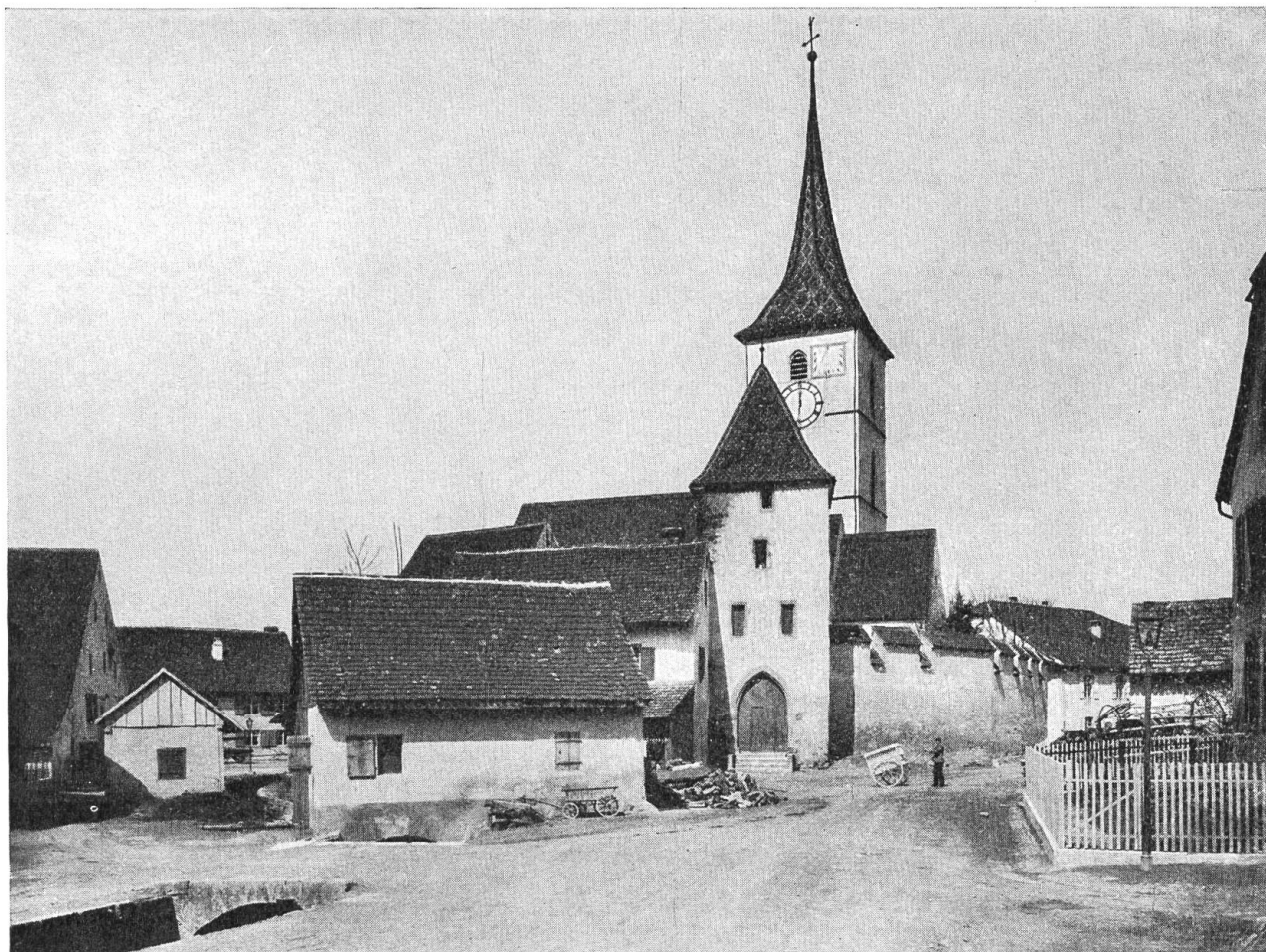
Muttenz. Die befestigte St. Arbogast-Kirche.