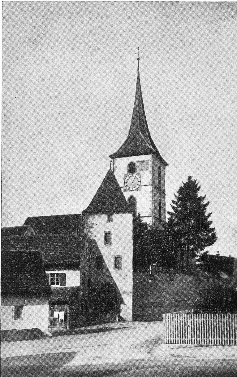
Die St. Arbogastkirche in Muttenz von Süden.

Fläche von beinahe 400 Quadratmetern. Die Kopien werden im Staatsarchiv in Basel aufbewahrt. Vorzüglich und in ihrer ursprünglichen Schönheit erhalten ist die gotische Decke über dem Schiff. Die Inschrift auf dem Mittelfries, das mit schönem gotischen Masswerk geziert ist, besagt, dass die Decke im Jahre 1504 erstellt worden ist.