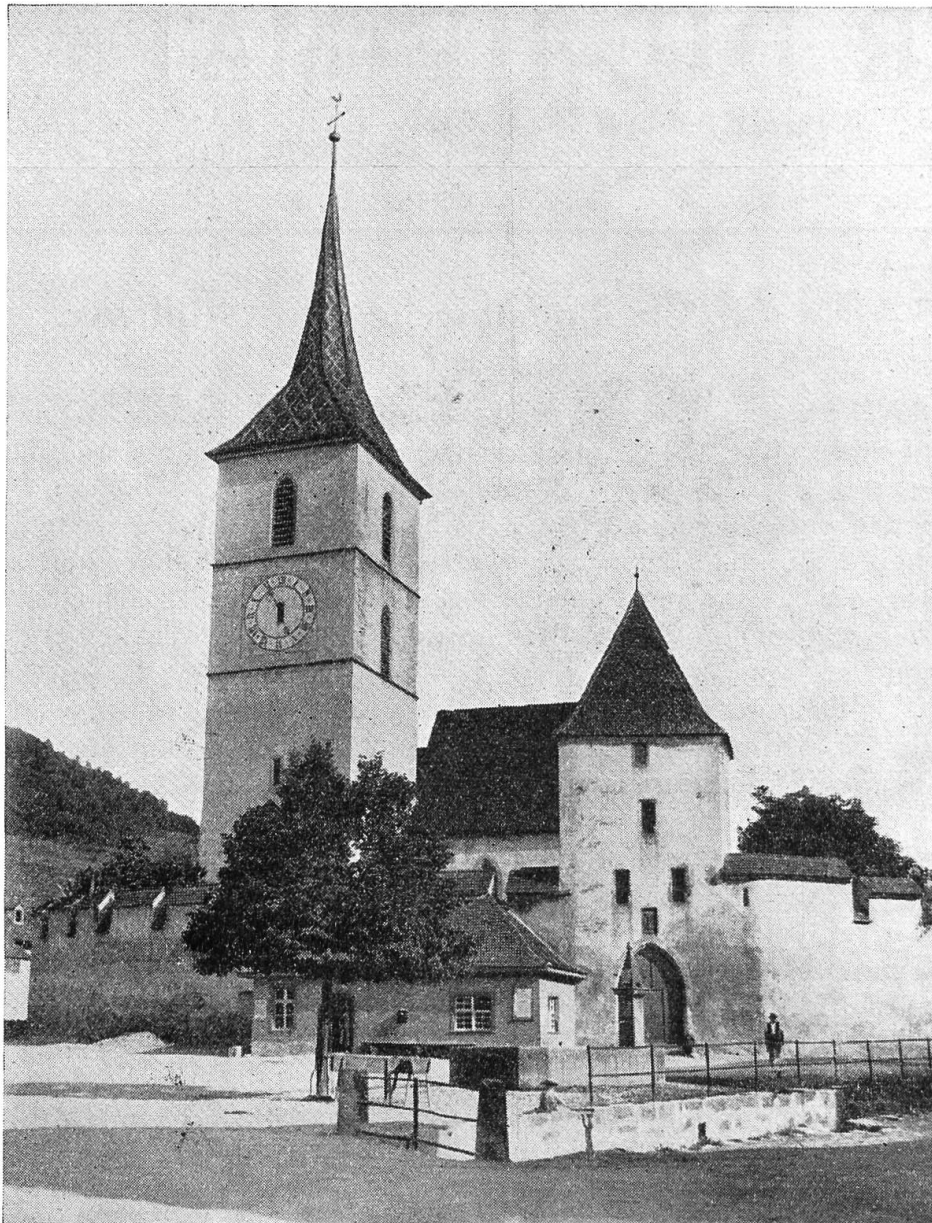
Die St. Arbogastkirche in Muttens von Norden.