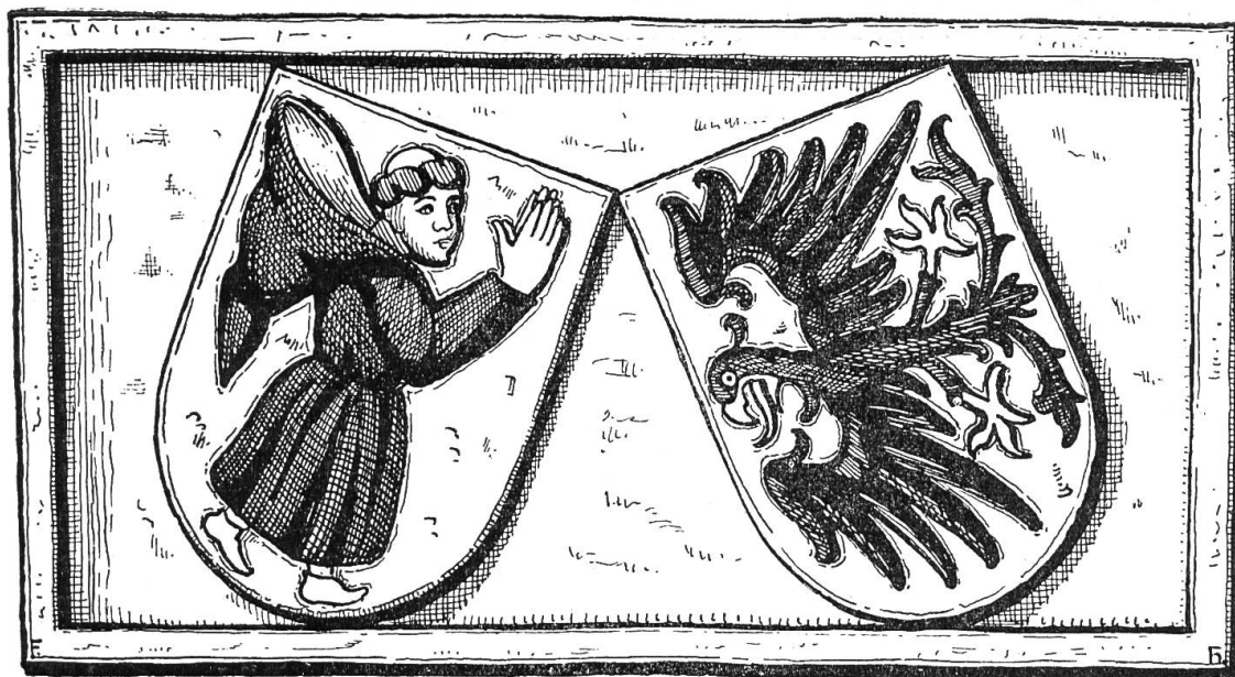
Allianzwappen Münch-Eptingen am Kirchturm.

Im idyllischen Kirchhof, verträumt an die Ringmauer angelehnt, befindet sich ein weiteres kirchliches Gebäude, die ehemalige Beinhauskapelle . Sie stammt aus dem 15. Jahrhundert und ist ebenfalls noch vorzüglich erhalten. Ein riesengrosser Christophorus und eine Schutzmantelmadonna zieren die Aussenfassade. Zwischen diesen beiden Bildern schimmert schwach und verblasst der Erzengel Michael hervor, wie er gegen den Satan zu seinen Füssen mit gehobenem Arm sein Schwert schwingt. Ueber dem grossen runden Fensterbogen steht die Jahreszahl 1513. Der Innenraum ist ausgestattet mit einer gotischen Flachdecke, die mit kostbaren Wandfriesen und einem Mittelfries geziert ist, worauf prächtige gotische Zierbänder mit Vögeln, Blumen und Früchten kunstvoll eingekerbt sind. In der Mitte ist die Jahreszahl 1513, verschlungen mit der Bezeichnung «Maria», angebracht. Die innere Westseite weist ein kulturhistorisch sehr wertvolles Jüngstes Gericht mit den Gerechten zur Rechten und mit den Verworfenen, den geistlichen und weltlichen Obern, zur Linken auf.