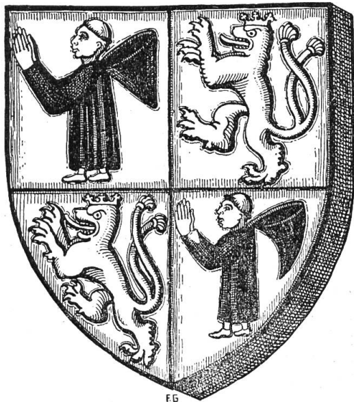
Wappenschild Münch-Löwenberg am Chorgewölbe.

abgetan». Trotz dieser radikalen Ausräumung ist die Gestalt der Kirche in- und auswendig gleich geblieben bis in die Neuzeit hinein. Das ehrwürdige, zur Andacht einladende Gotteshaus hat von seiner ursprünglichen Schönheit und Weihe nichts eingebüsst. Einzig die Fenster wurden, gemäss dem Bedürfnis nach mehr Licht, erweitert.