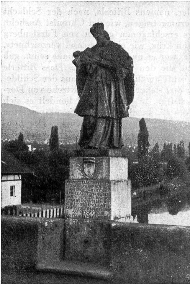
Die Nepomukstatue von Dornach.

Die Statue auf der Doubsbrücke in Saint-Ursanne zeigt ihn zudem mit fünf Sternen (von denen der eine offenbar abgefallen ist) um seinen Nimbus. Nach der Legende sollen nämlich fünf strahlende Lichter den Ort angezeigt haben, wo sein Leib in der Moldau lag.