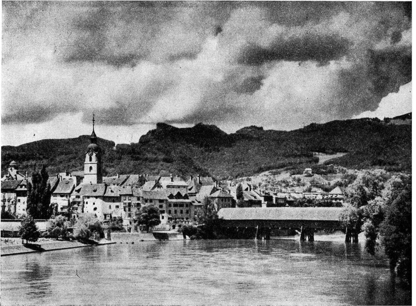
Oltner Altstadt mit dem Blick gegen den Jura

Sonne fällt auf diesen Hang, daß die Gegend unter der Froburg gar «Dürrenberg» geheißen wird.