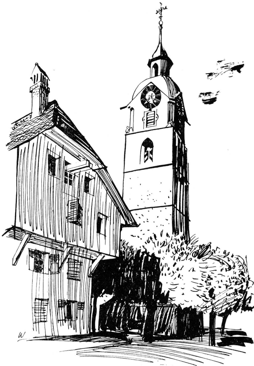
Der Glockenturm von Südwesten