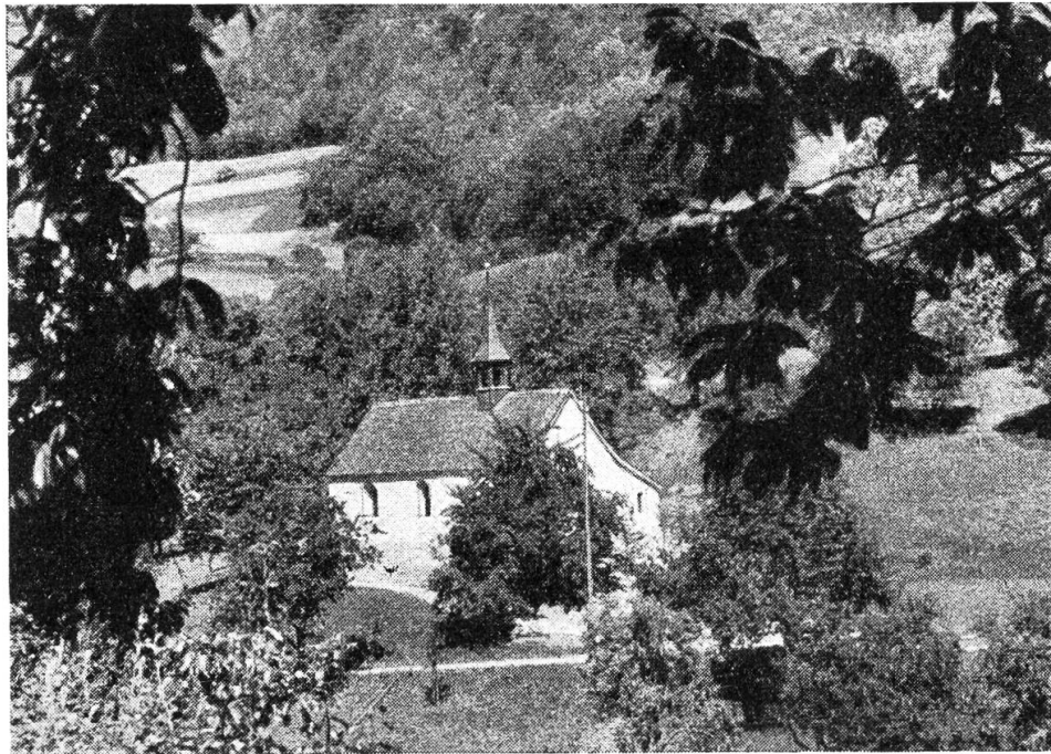
St. Ulrichskapelle in Rohr von Südosten nach der Restaurierung von 1946