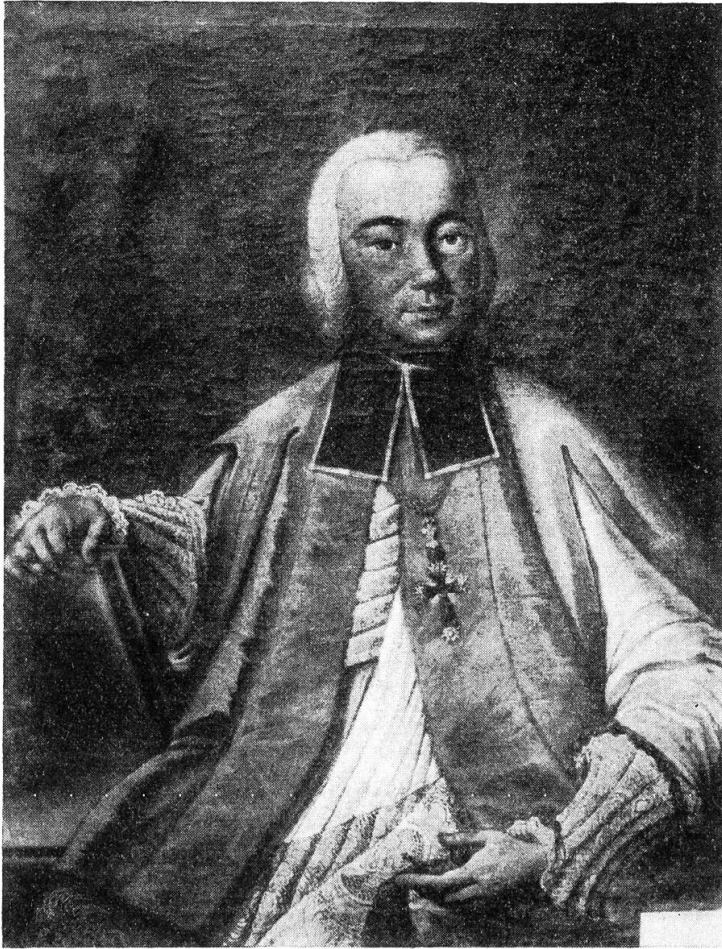
Johann Baptist Haus, Weihbischof von Basel 1729—1745

Ölbild im Museum Pruntrut, von G. Amweg † zur Verfügung gestellt