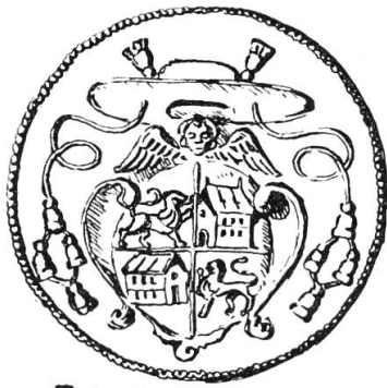
Joh. Christ. Haus 1685