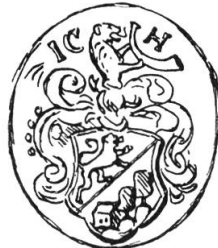
Stabhalter Joh. Chr. Haus 1759