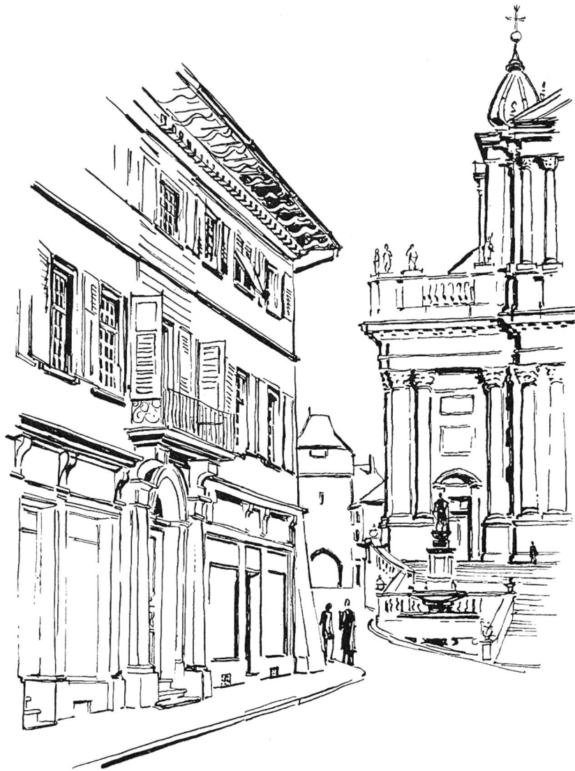
Haus von Sury-Vigier und Sankt Ursen