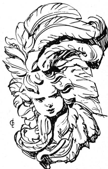
4. Engelsköpfchen in Flügelornament