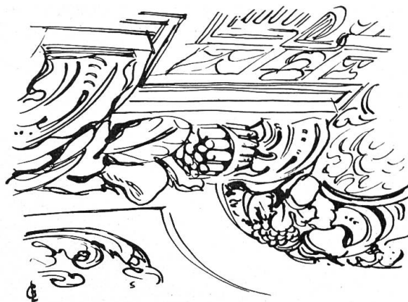
3. Detail eines Früchtekranzes am Chorgewölbe mit Spargelbündel

Um die Mitte des 18. Jahrhunderts wurde die Jesuitenkirche, dem damaligen Geschmack entsprechend, mit einem Rosaton ausgemalt, während alle plastischen Teile später einen Kalkfarbanstrich erhielten.