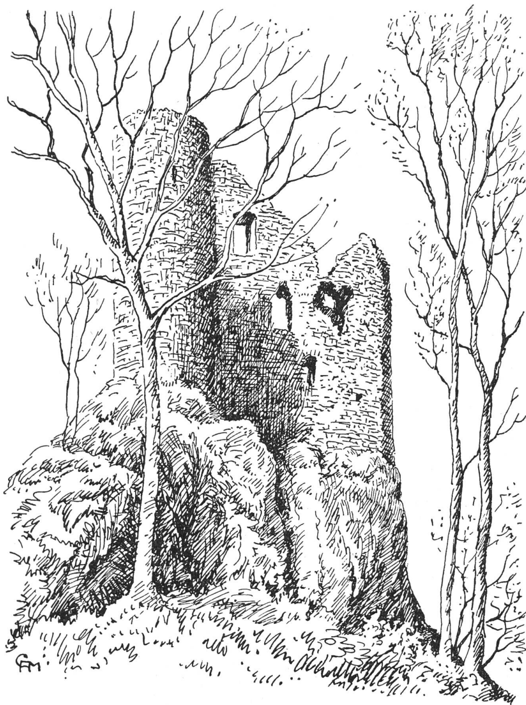
Burg Reichenstein vor dem Wiederaufbau Zeichnung von C. A. Müller