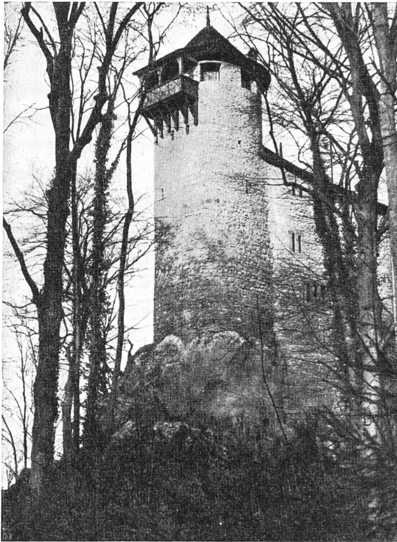
Burg Reichenstein in ihrem heutigen Zustand. Ansicht von Süden

fangs des 16. Jahrhunderts.) Länger aber und größtenteils im Besitz der Gesamtfamilie blieb die Landskron bei Mariastein reichensteinisch (ab 1461). Lehensherren waren je hälftig die Herzoge von Oesterreich und die Markgrafen von Hochberg, später die von Baden. Als Frankreich als Beute des Dreißigjährigen Krieges 1648 die österreichischen Herrschaftsrechte im Elsaß an sich gebracht hatte, kaufte es 1663 die badischen Markgrafen aus ihrer halben Lehenshoheit über Landskron und gleichzeitig die Reichensteiner aus ihren Rechten als Lehensträger aus und baute die Burg zu einer modernen Festung um.