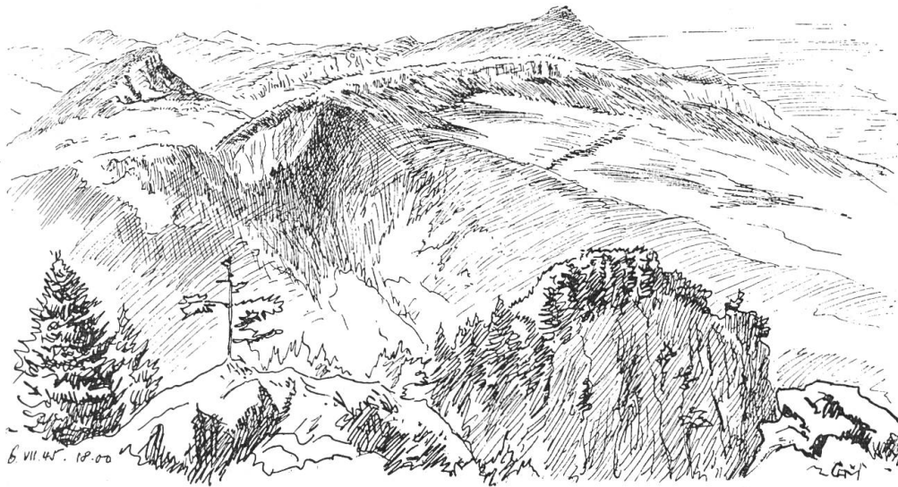
Blick vom Balmfluhköpfli ostwärts auf Kambenfluh, Hofbergli und Rüttelhorn Tuschzeichnung von C. A. Müller, Basel

Des Weges letzte Wendung Führt weg aus Raum und Zeit, Zum Gipfel der Vollendung Und zur Vollkommenheit.