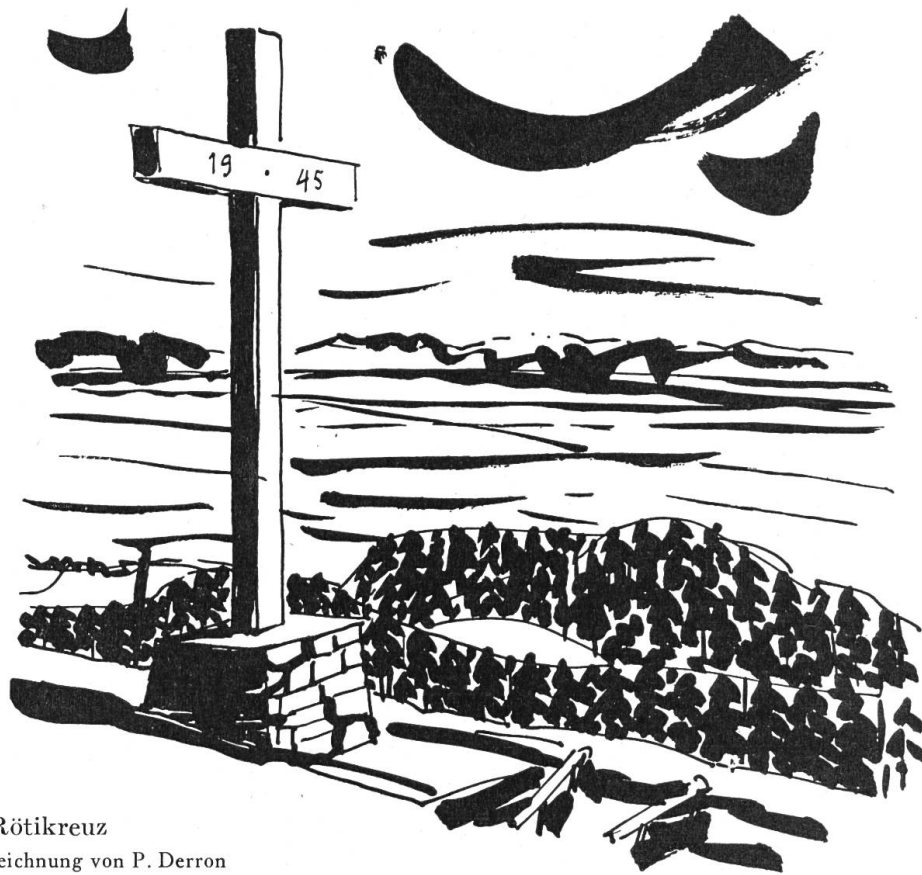
Das Rötikreuz Tuschzeichnung von P. Derron

Bevor wir vom gesegneten, von schützenden Felswänden und würzigen Waldhängen umsäumten Balmbergsattel, seinen grünen Triften, trauten Gaststätten und behäbigen Sennhöfen Abschied nehmen, schweift unser Blick nochmals zum Bergkreuz auf der hohen Rundzinne der Röti, dessen Arme friedvoll das geheiligte Zeichen an die strahlend blaue Seide des unendlichen Himmelszeltens heften.