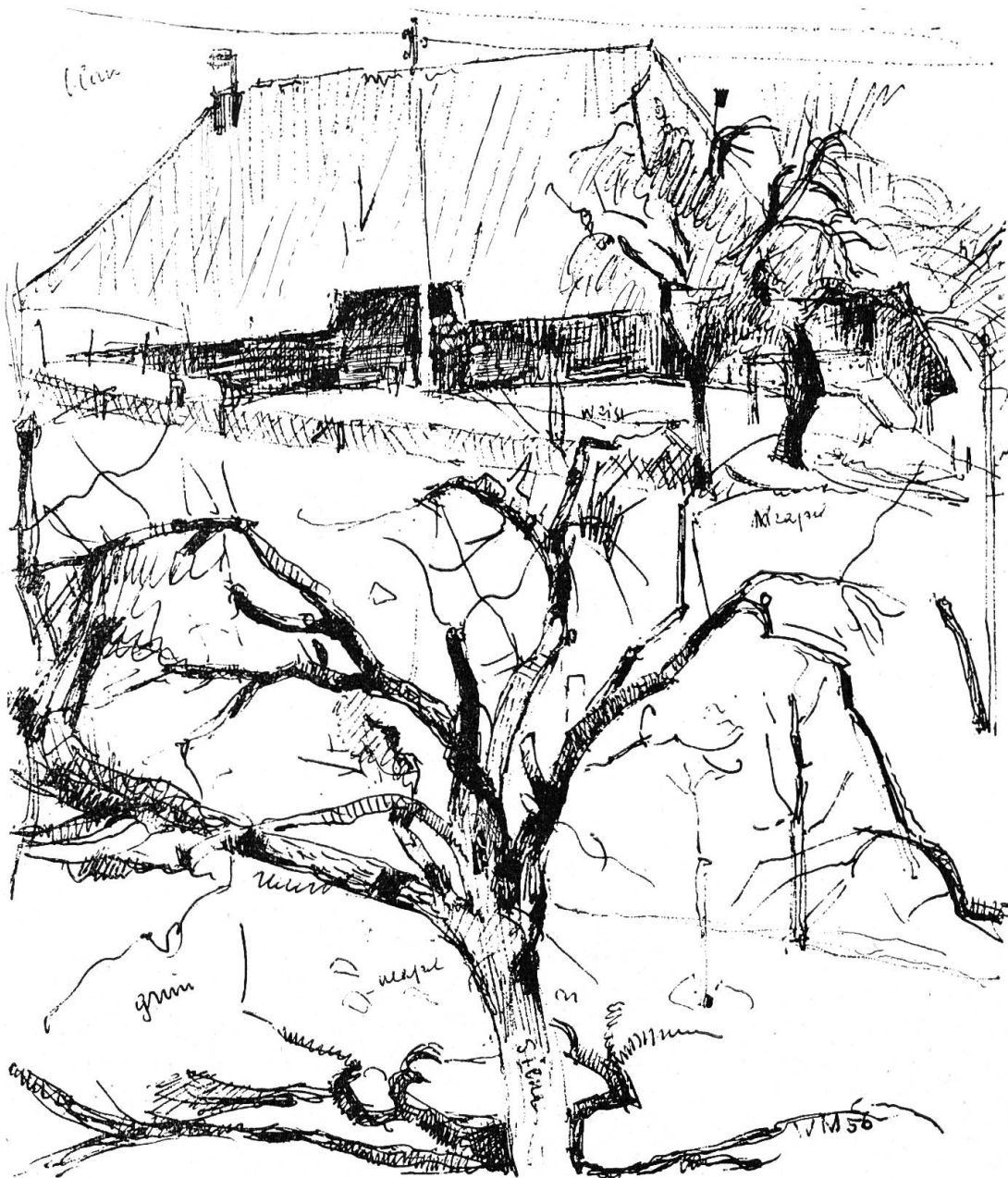
Zeichnung von Werner Miller

Summormorgen use. Wie cha men au furt goh, vomene settige schöne Flächen Aerde ewägg?! Er cha goh, sowyt as ne d Füeß träge, es schöners Bildli wird er nie mehr gseh. Aber wenn er einist do i däm Schuelhüsli obe z grächtem wott yhuse, denn mueß er jetz s Fänster zuemachen, und er darf nümme gäng dört vüre luege — —