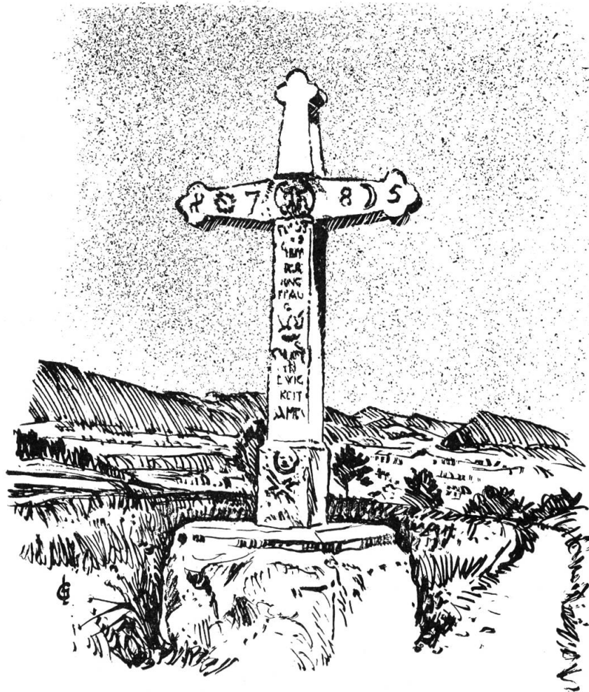
Das Wegkreuz auf der Wilerhöhe (1785) Zeichnung von G. Loertscher

In Erlinsbach lagen die Stiftsreben. In guten Jahren hieß es dann: «Mensis enim totus fuit invitatio potus» — «an jedem Montag, sie luden zum Bechergelage . . .»