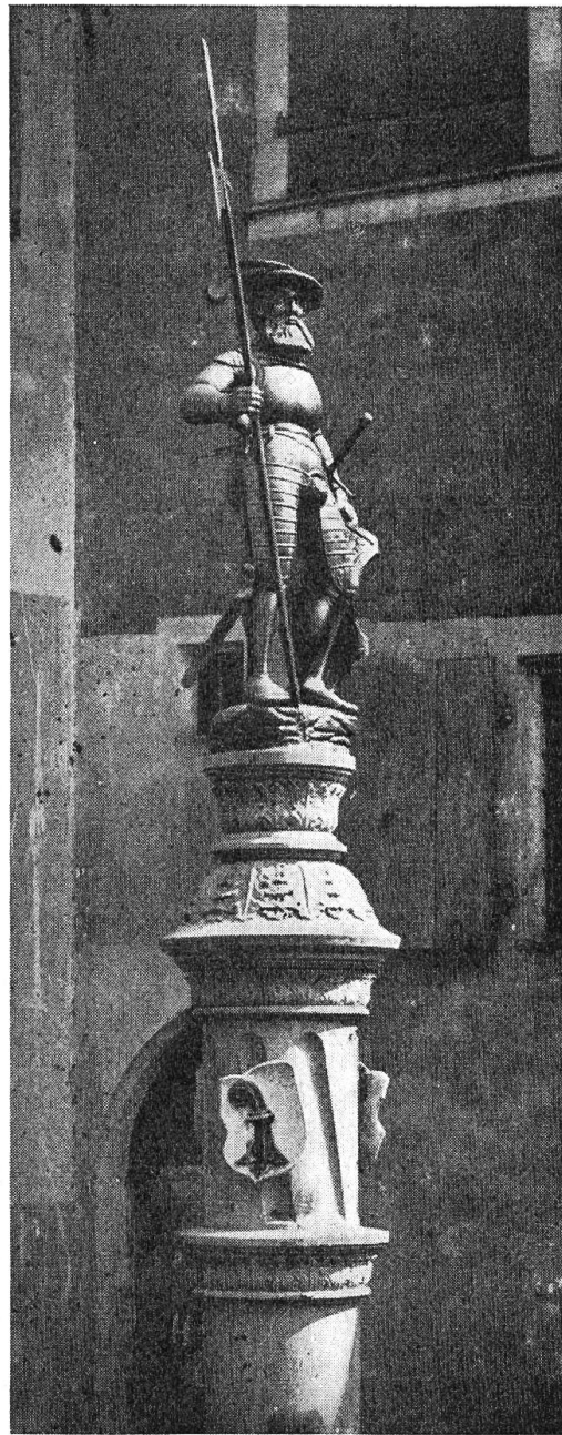
Säule und Figur des Kornmarktbrunnens vor der Versetzung auf den Martinskirchplatz. Statue von 1546/1547.

Weiterhin ist darauf hinzuweisen, daß vom 14. Jahrhundert an bis zur Reformation auf dem Kornmarkt in Basel ein Bildnis (eine Malerei oder