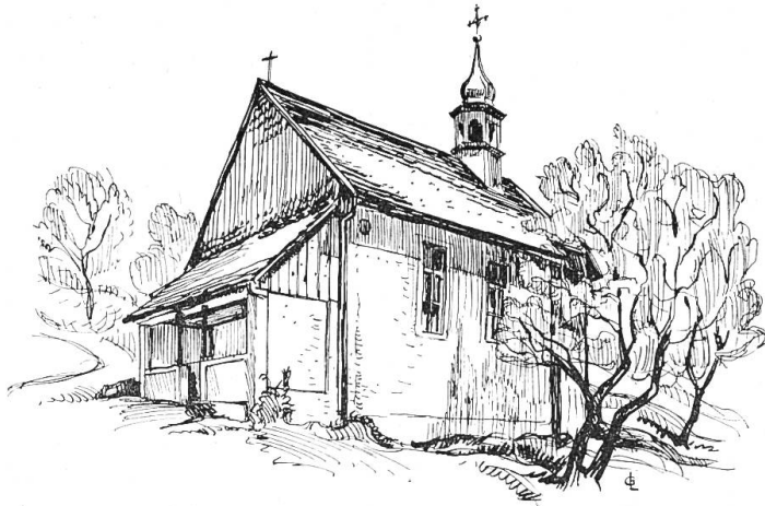
Vor der Restaurierung