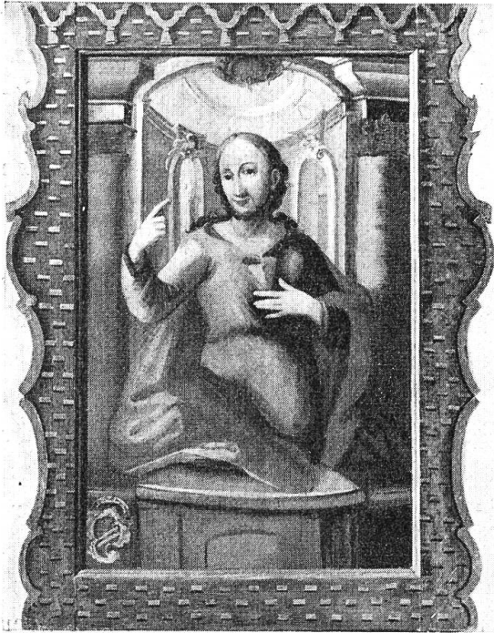
Der predigende Christus von Fabian Thurner (um 1766), ein selten dargestelltes Motiv, aus der alten, 1866 abgebrochenen Kirche von Laupersdorf, ziert nun die Hönger Kapelle.

Formen nachgebildet und in warmem Holzton lasiert. Die geflickten und verfleckten Wände nötigten zu einem Dispersionsanstrich, «im Tone alten, vergilbten Papiers», der im zweiten Anlauf annähernd erreicht wurde. Große Mühe verursachte auch die von zäher Oelfarbe überzogene Felderdecke. Es gelang, sie abzulaugen und das Holz wieder zu zeigen. Der honigfarbene Ton spielt gut mit den Lasuren der neuen Bestuhlung und schafft eine angenehme Raumstimmung, die durch passendere Fenster freilich hätte gesteigert werden können. Scheiben ersetzen ist aber wegen der Stifter meist eine heikle Angelegenheit. Für die neue Beleuchtung galt der Grundsatz: möglichst zweckmäßig und unauffällig, — abgeschirmte Lichtquelle über dem Eingang, Pendellampen im Schiff, indirekte Anstrahlung des Altars. Heizung: elektrisch.