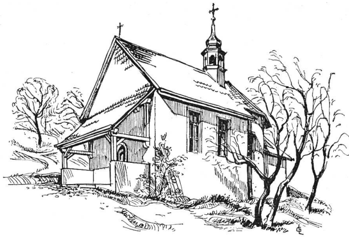
Nach der Restaurierung

war, und zahlreich sind auch in der Schweiz die Zeugnisse von St.-Jago-Pilgern. Der Kapelle war ein Bruderhaus angeschlossen, ähnlich wie in Rohr, in Rickenbach und auf dem Born. Nach den Stürmen der Reformation, der auch die Ausstattung der Kapelle zum Opfer fiel, hören wir häufig vom schlechten Zustand der Kapelle, die stets durch Wasserschaden gefährdet war. So transferierte man sie schließlich im Jahre 1714 an die Nordostecke der eigentlichen Siedelung. Die Mensa des Altares trägt die Jahrzahl 1715.