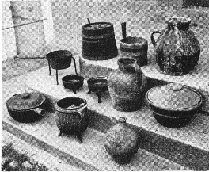
Alte Bauernhäuser und Landsitze sind gelegentlich noch heute angefüllt vom Keller . . .

noch mehr aber rasch entschlossene Praktiker und Schlauberger, welche es verstanden, sich diese achtlos beiseite geschafften Antiquitäten anzueignen und sie um teures Geld an Liebhaber zu verkaufen. Was man damals von solchen — jetzt hoch geschätzten und entsprechend bezahlten — Gegenständen hielt, mag ein Beispiel aus einem Baselbieter Dorfe zeigen. Ein Altertumsfreund bot den Mannen vom «Glöggeli-Wagen» für jeden kupfernen Gegenstand, den sie für die Abfallgrube mitführten, einen Fünfliber an. Er wurde im ganzen Dorf verlacht, und man zweifelte an seinem gesunden Verstand, weil er das Geld so verschwende. Er aber sammelte liebevoll alle die herrlichen Kupfergefäße von der einfachen Schöpfkelle bis zum großen «Gepsi». Heute zahlt man für die größeren Stücke Preise von hundert Franken an aufwärts.