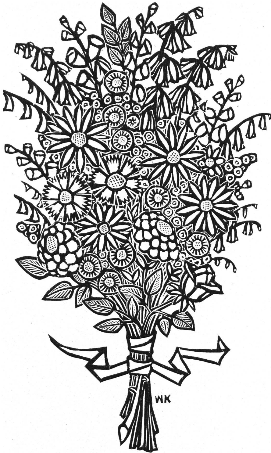
Holzschnitt von W. Kohler