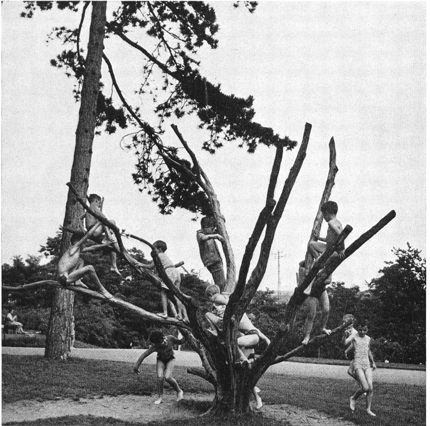
Die stark verzweigte Eibe eignet sich mit ihren dünnen, aber außerordentlich zähen Ästen in hohem Maße als Kletterbaum (Bildbuch S. 126)