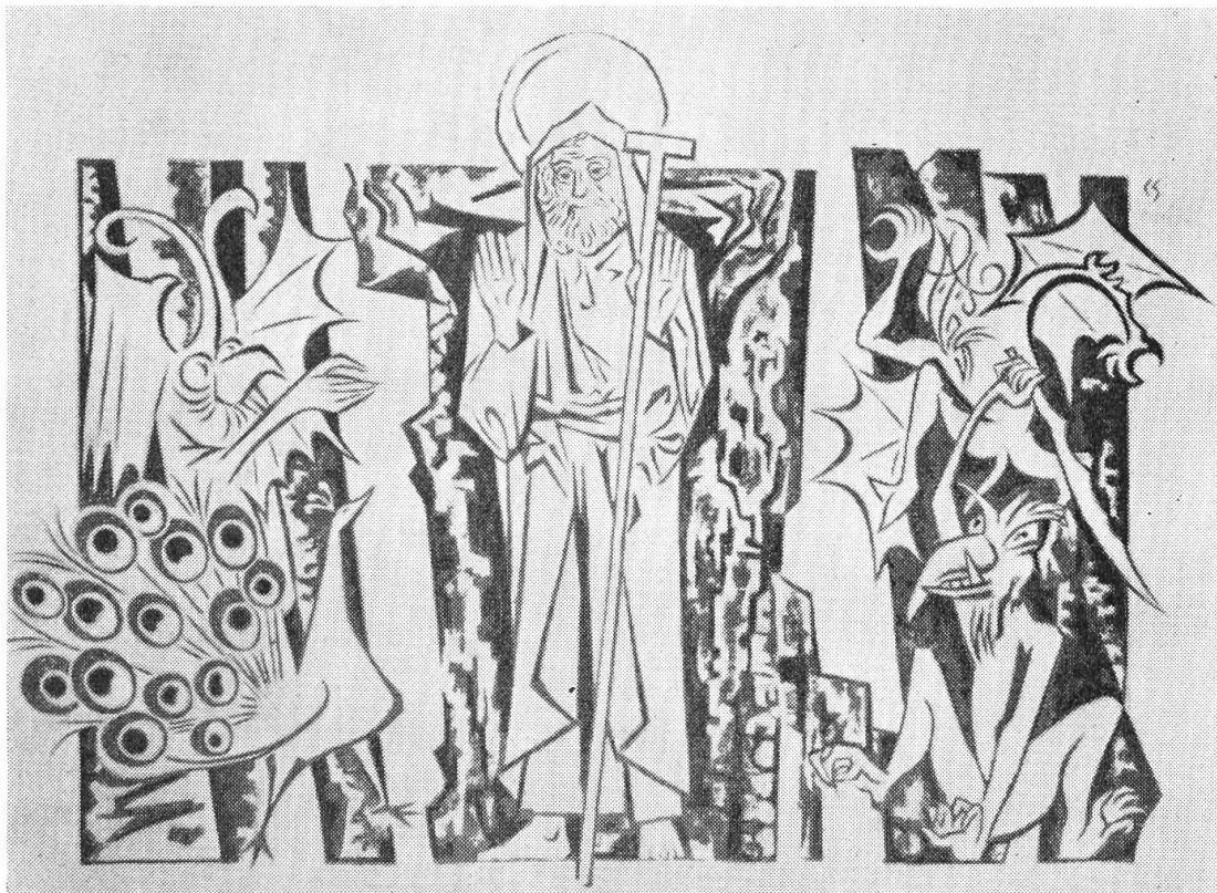
Das neue, dreifarbige Sgraffito an der Nordwand der Kapelle. Es stammt von C. Spiegel und stellt die Versuchung des hl. Antonius dar.

dene Malerei wieder eine Nachfolgerin gefunden. Spiegel verstand es, dem Heiligen Würde und Größe zu geben, andererseits die Teufel so zu gestalten, daß sie nicht trivial wirken oder den Wallfahrer irritieren. Die Versuchung des hl. Antonius ist nicht nur seit je ein beliebtes Thema der Malerei gewesen, sie ist auch für den Christen eine wirklichkeitsnahe Idee.