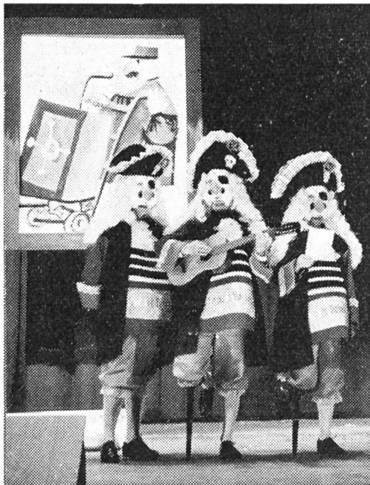
Schnitzelbank der «Brennessle» am Trommelkonzert