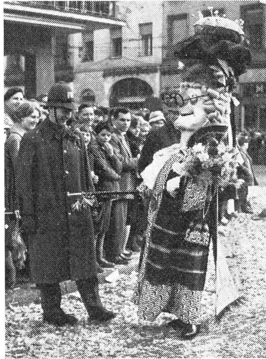
Tambour-Major der «Wettstai»-Clique

resp. Pfeifermarsch produzieren. Die einzelnen Trommelnummern werden unterbrochen, oder besser miteinander verbunden durch ein eigentliches Fasnachtliches Rahmenspiel, das in geistreichster Form die Geschehnisse des Jahres glossiert.