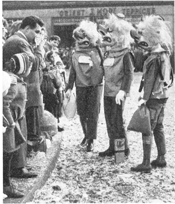
Intrigierende Studenten-Waggise. Die Konfettis am Boden nennt man «Räppli»

und vom Wagen aus verteilt werden und auf denen in mehr oder weniger dichterischer Form das Sujet ausgeschlachtet wird. Neben dem Trommeln aber bedeutet die Fasnacht für den Basler insofern viel mehr, als er da die Möglichkeit hat, sorgsam aber witzig kostümiert und maskiert sich durch die Straßen und in die Restaurants zu begeben und Bekannte und Familienangehörige zu «intriguieren» d. h. ihnen mit viel Witz verschiedene Dinge mitzuteilen, die entweder angenehm oder unangenehm sind und die der unmaskierte Zuhörer ebenfalls mit Witz und Ironie beantwortet. So ist es auch möglich, daß ein auswärtiger Besucher der Basler Fasnacht durch irgend eine männliche oder weibliche maskierte und kostümierte Person angesprochen wird. Er möge dies mit gutem Humor aufnehmen und ebenfalls lustig antworten — auf jeden Fall aber nicht schroff sein und niemals die Maske abreißen.