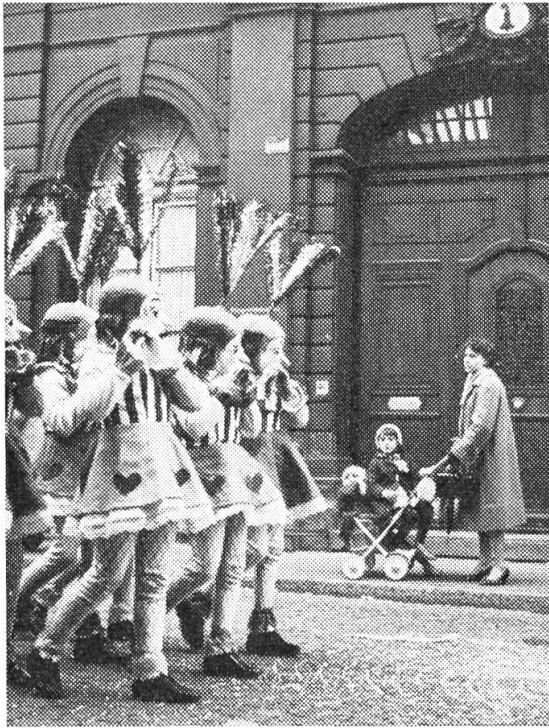
Pfeifergruppe der «Junge Bebbi»