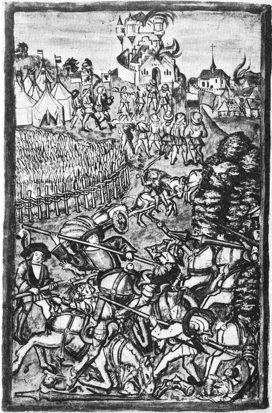
Der Sundgauerzug 1468, nach Diebold Schillings Luzerner Chronik