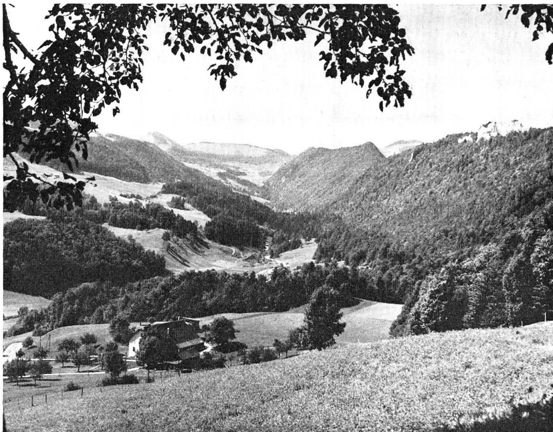
Blick von der Passwangstrasse auf das hintere Guldental

An einer Konferenz am 26. Oktober 1961 in Mümliswil, an der auch der SNV seinen Standpunkt geltend machte, konnte dann folgende vernünftige Übereinkunft getroffen werden: der Bund erwirbt höchstens den eigentlichen Zielhang («Moos»); es wird an nicht mehr als 100 Tagen pro Jahr geschossen und zwar ohne Einsatz von Panzern (Flieger nur an max. 10 Tagen) und höchstens in Kompagniestärke. Permanente Einrichtungen waren nicht geplant. Oberstkorpskommandant Frick, Chef der Ausbildung, gab zu diesen Zusicherungen sein «Ehrenwort als Offizier». Es zeichnete sich dann die Lösung ab, dass der Kanton den Zielhang erwerben und an den Bund verpachten würde. Im Sommer 1964 erfolgte jedoch — einigermaßen überraschend — der ausdrückliche Verzicht des EMD auf das Guldentaler Schiessplatzprojekt «aus verschiedenen Gründen».