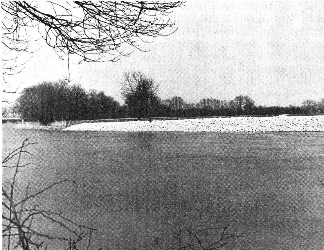
Die ersten Verbauungen der II. Juragewässerkorrektion bei Grenchen

Prozent ausgerechnet! Nur 14 von 700 angefragten Industriefirmen haben der Aargauischen Handelskammer gegenüber ein gewisses Interesse an der Schiffbarmachung der Aare mitgeteilt. Jeder Umlad vom Schiff auf Bahn oder Strasse kommt teurer als die Direktbedienung per Schiene oder Camion. Eine besondere Expertise der Schweizerischen Vereinigung für Landesplanung zeigt (1965), dass mit dem seit 60 Jahren immer wieder aufgetauchten, aber stets wirklichkeitsfremden Kanalprojekt nur eine weitere unerwünschte Zusammenballung von Industrien und Siedlungen am Flusslauf sowie eine Verspekulierung bester Agrarflächen und der Verlust eines zentralen Erholungsraumes erreicht würden. Vom Gewässerschutz-Institut der ETH wird darauf hingewiesen, dass schon in wenigen Jahren auch Aarewasser zu Trinkwasser aufbereitet werden müsse, und dass es andererseits keine Binnenschifffahrt ohne ständige Verölung (auf dem Rhein täglich 11 000 Liter!) durch Schiffe, Hafenanlagen und ufernahe Industriewerke gibt. Leider versprechen sich die welschen Kantone von der Schifffahrt (seit notabene 60 Jahren . . .) «blaue Wunder», und auch die bernische Regierung und die Bauleitung der Juragewässerkorrektion haben eine «Aare-Wasserstrasse» als erstrebenswertes Ziel verkündet.