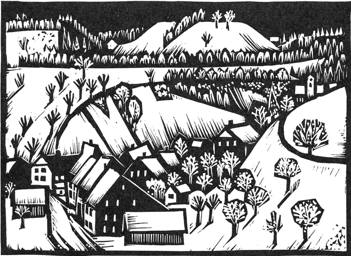
DIEGTEN IM WINTER

Diegten im Winter. Linolschnitt W. Eglin.