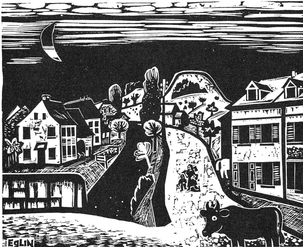
Der Zunzger Büchel. Holzschnitt W. Eglin (1895—1966).

alte Nordsüdverbindung führte bei Rheinfeldern, das übrigens etliche Jahre vor Basel eine Rheinbrücke besass 6 , über den Rhein, dann an der Sissacher Flue mit ihrer Fluchtburg vorbei nach Sissach und darauf durchs Diegtertal über das Chall; von da aus konnte man gegen Osten über Ifental Olten erreichen oder südwärts gegen Hägendorf absteigen. Sissach lag demnach am Kreuzungspunkt zweier bekannter Verkehrswege, und so lässt sich auch seine Bedeutung als Hauptort des fränkischen Sisaues erklären. Im Diegtertal ist der Zunzger «Büchel» besonders erwähnenswert; durch eine Grabung konnte nachgewiesen werden, dass hier eine frühmittelalterliche Holzburg gestanden haben muss 7 . In Diegten stand neben der Kirche ein Wohnturm, und auf den Anhöhen um Eptingen sind uns fünf mittelalterliche Burgstellen bekannt; sie waren wahrscheinlich alle im Besitz der Herren von Eptingen. Der Weg von Rheinfeldern über Sissach und das Chall dürfte bis um 1200 seine Bedeutung gehabt haben. Damals war er die kürzeste Verbindung zwischen den Zähringischen Besitzungen in Süddeutschland und im Schweizer Mittelland. Mit dem Bau der Rheinbrücke in Basel und der Eröffnung des Weges durch die Schöllenen zum Gott-hard geriet er in Vergessenheit.