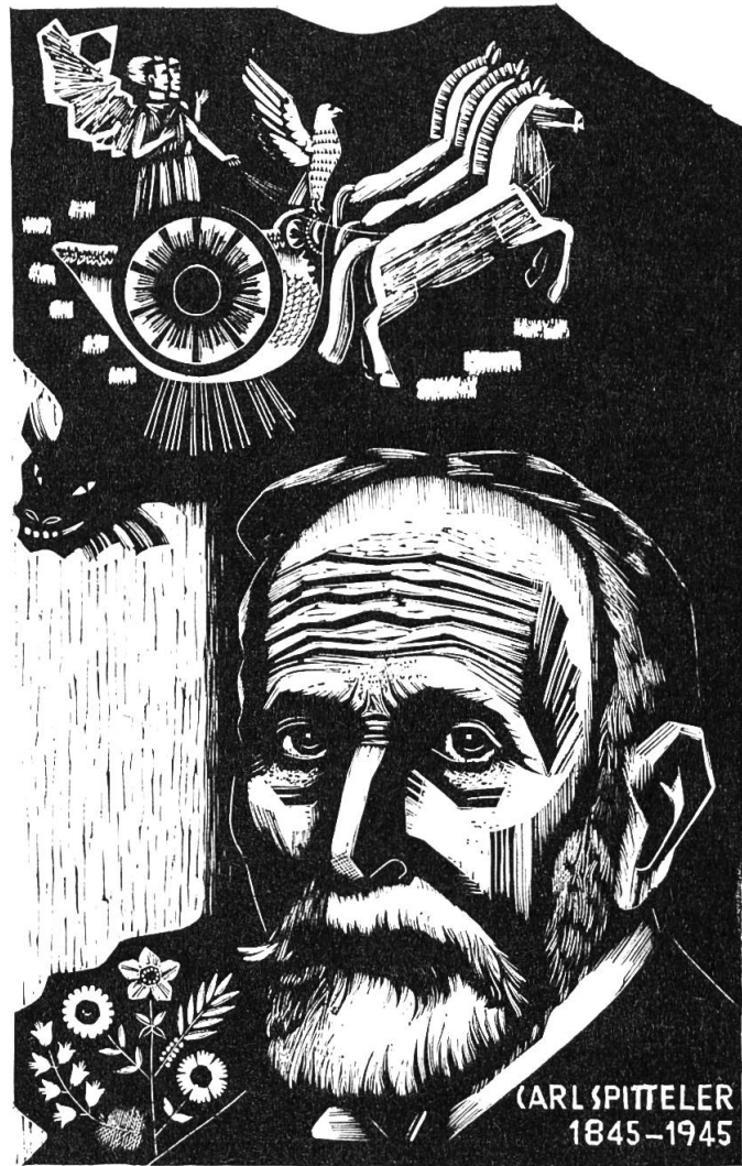
Carl Spitteler. Holzschnitt.