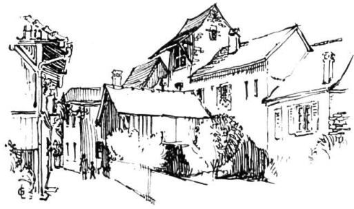
Das ehemalige Wassertor.

sanitären Anlagen, die vielen Verkleidungen aus Aluminium, sie alle können aus Laufen stammen. Beim Arbeiten werkt man vielleicht in einem Laufener Überkleid und isst Brot, dessen Getreide bei uns gemahlen wurde. Der Jugend sind unsere Fünfermocken und Mohrenköpfe nicht unbekannt. Vielleicht lest ihr die Tageszeitung und das Wochenblättchen auf unserem Papier; auch die neue Gartenmauer aus Naturstein kann aus Laufen sein. Wenn ihr endlich, bei irgend einem Anlass, in gehobener Stimmung eine gute Flasche aus dem Keller holt, so braucht der Wein nicht von Laufen zu sein, obwohl es früher auch solchen gab, aber der Korkzapfen kann sehr wohl wiederum eines unserer vielen industriellen Produkte sein.