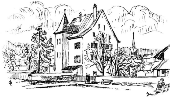
Das Amthaus ehemaliger Hof des bischöflichen Verwalters.

Nun dürfen wir der Stadtgründung von 1295 keine allzugrosse Bedeutung beimessen. Politisch wurde damals weniger Neues geschaffen als Bestehendes sanktioniert. Der Rat wurde in freier Wahl von den Bürgern bestimmt, doch der Stadtmeier konnte nur vom Bischof selbst auf Lebenszeit ernannt werden. Praktisch besorgte die wichtigsten Amtsgeschäfte der Landvogt des Bischofs, mit Wohnsitz im Schloss Zwingen.