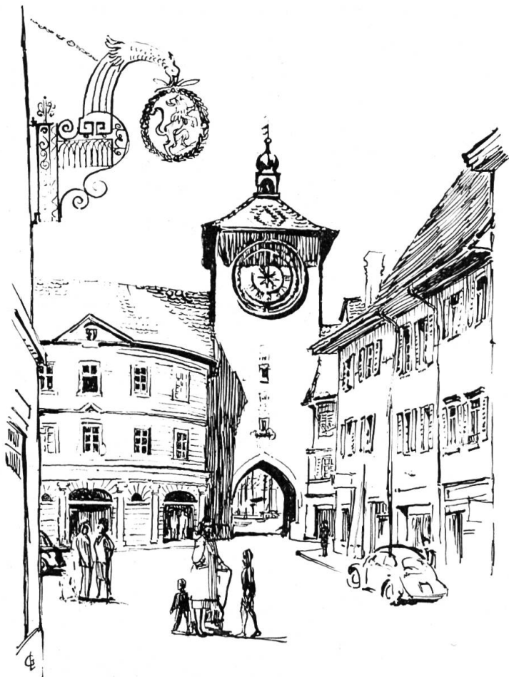
Delsberger- oder Obertor und Rathaus.