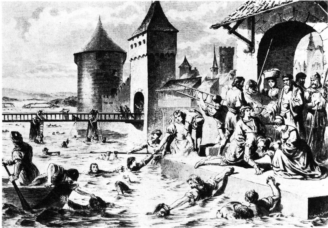
Die grossmütigen Solothurner. Holzschnitt nach einer Zeichnung von Martin Disteli. (Photo: Zentralbibliothek Solothurn).