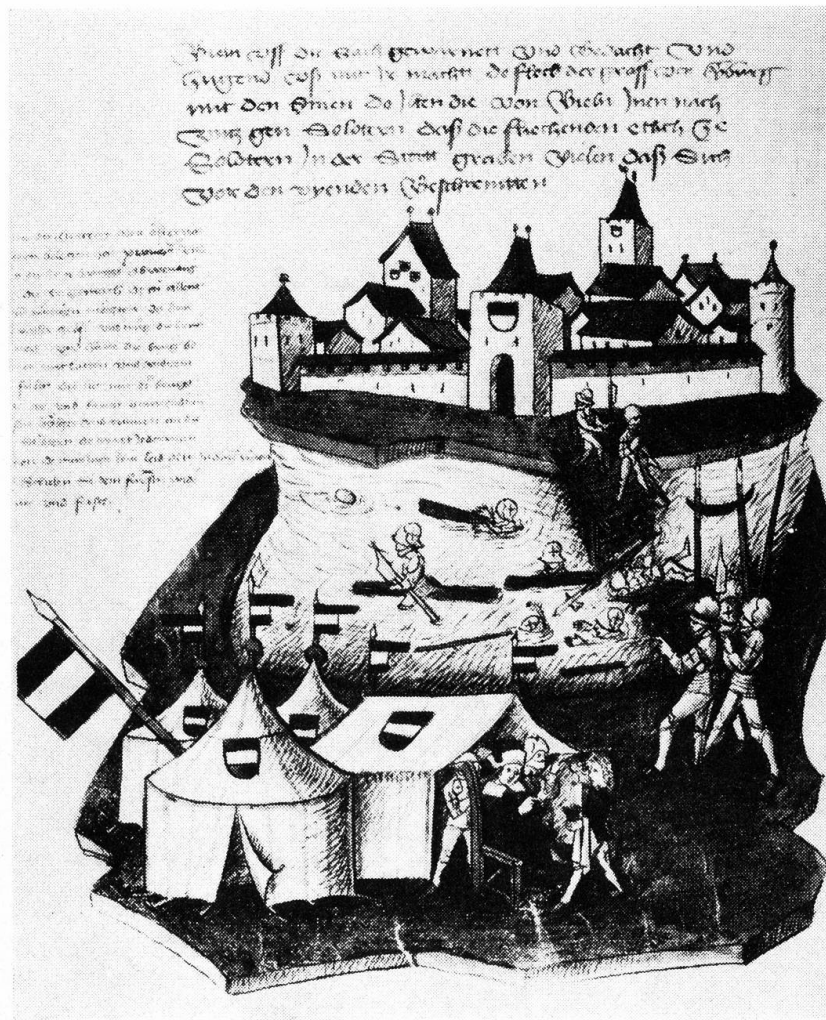
Die Belagerung von Solothurn in Bendicht Tschachtlans Berner Chronik..

Neben dem Reiche und seinem Vertreter bildete die zweite Gewalt in der Stadt immer noch das St. Ursenstift. Seit etwa 1240, also fast seit 80 Jahren, stand allerdings das Stift in einem immer wieder aufflammenden Streit mit der Bürgerschaft, die seit der Zähringerzeit die ursprüngliche Oberhoheit der Stiftsherren über die Stadt immer mehr zurückzudrängen suchte. Zur Zeit der Belagerung stellte das Stift aber noch eine recht beachtliche politische Macht dar. Sein Herrschaftsgebiet war weit grösser als das bescheidene Bürgerziel der Stadt: es umfasste nördlich der Stadt das Gericht Langendorf mit Bellach, Oberdorf und