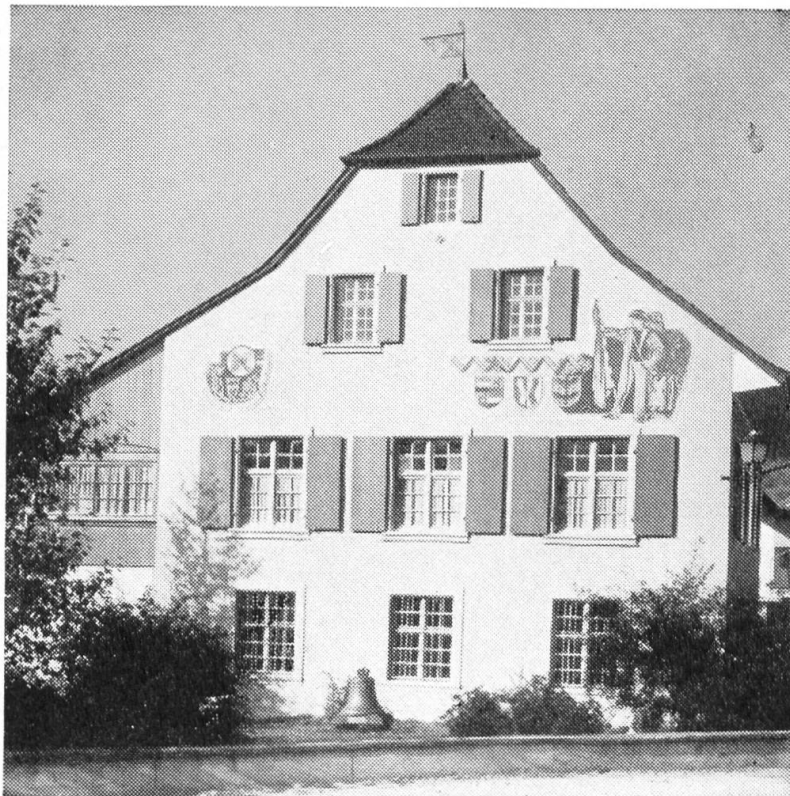
Südseite des Museumsgebäudes

dar, mit dem bei Treibjagden grosse Waldpartien abgesperrt wurden. An der gleichen Wand entdecken wir eine Fülle von landwirtschaftlichen und handwerklichen Geräten : Neben dem Heurupfer hängt der Distelstecher, neben der Sichel, dem Doppeljoch und dem Dreschflegel die Wuhraxt, neben dem Streichmass die Setzwaage und etwas höher einige Strumpf- und ein Hutmodel. Eine Sammlung von Lampen und Kerzenhaltern lässt die trauliche Stimmung in den Spinnstuben erahnen; für eine Stimmung anderer Art sorgten drei Glasgemälde aus der Kirche , die von der Kirchenpflege dem Museum ins Depot gegeben wurden. Sind sie auch keine grossen Kunstschatze, so behalten sie doch ihren Wert als Sissacher Erinnerungsstücke. Der Druckli- und der Car-à-banc-Schlitten rufen bei ältern Leuten Kindheitserinnerungen wach, und die ledernen Feuereimer lassen erkennen, wie man einst bei den nicht seltenen Bränden das entfesselte Element bekämpfte. Wir erfahren hier auch, was die Ausdrücke «rätsche» und «hächle», die neben «Tüpfli» und «Pappetüpfli» noch immer zum Sprachgut des Baselbieters gehören, ursprünglich bedeuteten. Wenn wir uns über alle in die-