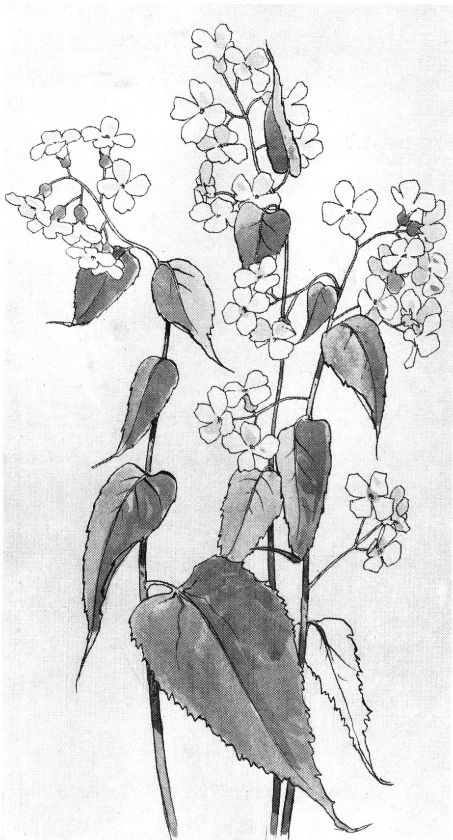
Ausdauernde Mond- viole