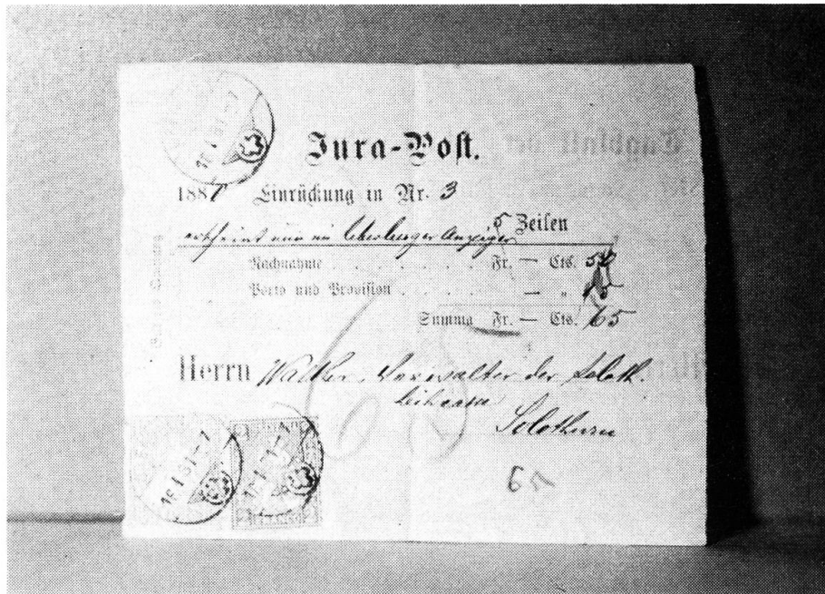
6. Inseratenrechnung der «Jura-Post» 1880