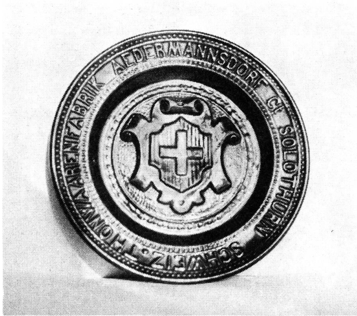
3. Musterteller aus grünem Kachelgeschirr aus der Tonwarenfabrik Aedermannsdorf (um 1900)

Tränen- und anderen Gefässen, zum Theil etrusch, zum Theil aus der Kachelifabrik von Matzendorf».