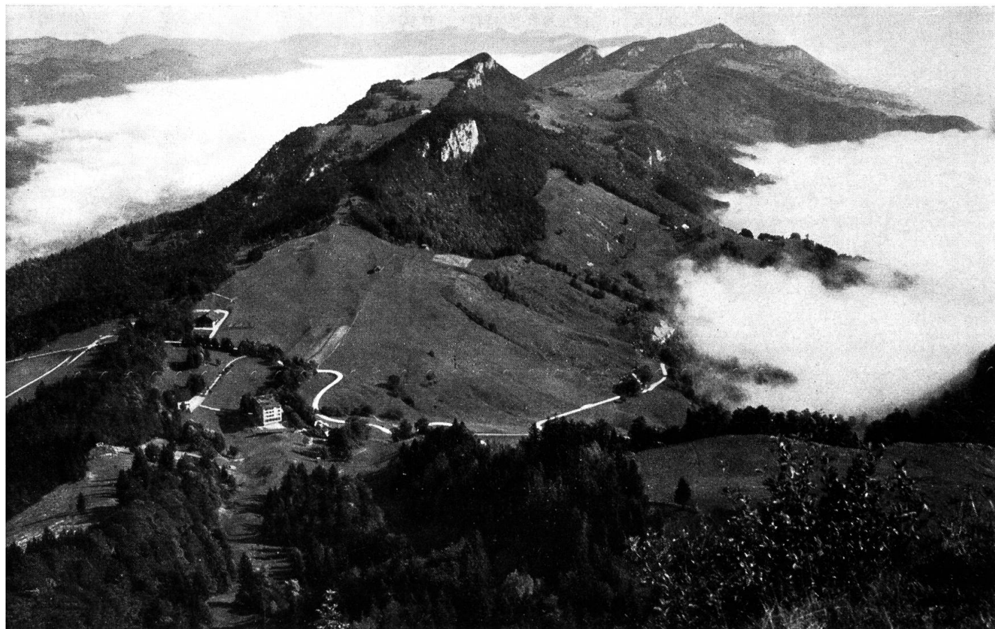
Blick von der Röti.