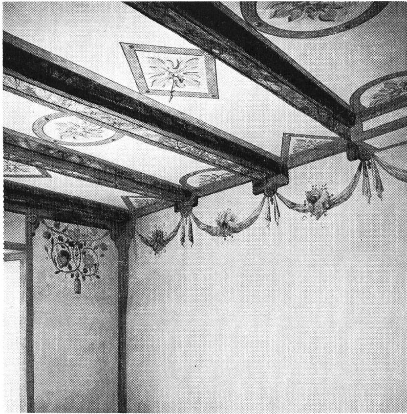
Steinenvorstadt 6, II. Stock. Ausgemaltes strassenseitiges Zimmer an Nr. 8, Eckpartie, Fassadenmauer/Brandmauer. Zustand nach Restaurierung, Ausmalung um 1600.

Wiederaufbau eines Gartenpavillons, die Französische Kirche am Holbeinplatz, das Thomas Platter-Haus an der Gundeldingerstrasse 280, das Haus zum Breisach am Obern Heuberg 16, das Bollwerk Dorn-im-Aug beim Heuwaageviadukt, St. Johannsvorstadt 14, die alte Pfandleihe, St. Johannsvorstadt 31, das Klösterli, die Kartause (Bürgerliches Waisenhaus), Klingental 1 (ehemals mittlere Klingentalmühle), Leonhardsgraben 63, zum Oelenberg, die Martinskirche, Petersgasse 42, der Pfaffenhof, der Rebhaus-, Sevogel- und Webernbrunnen, das spätgotische Haus Webergasse 12 (Abbruch), in Riehen das Lüscherhaus an der Baselstr. 30 und das De Bary'sche Landgut, Baselstr. 61/65, der Wenkenhof, in Bettingen der Dinghof, Brunnengasse 8, und die Chrischonakirche.