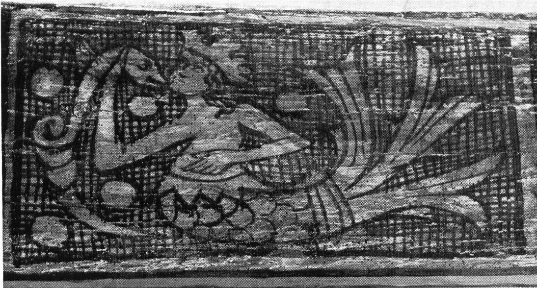
Nadelberg 6, Schönes Haus. Bemalte Balkendecke im Parterre des Haupthauses. Detail: Sirene. 2. Hälfte 13. Jh.

digen vermehrten Schutz unserer Altstadt ist erreicht worden durch die vom Grossen Rat auf Antrag seiner vorberatenden Kommission (Präsident Arch. Peter H. Vischer) am 5. Juli genehmigte Erweiterung der violetten Zone. In ihr haben die seitens der Denkmalpflege gemachten Ergänzungsvorschläge weitgehende Berücksichtigung gefunden. Zu kurz gekommen dürfte wiederum das Kleinbasel sein, da bedauerlicherweise für bereits eingegebene und zum Teil schon bewilligte grosse Neubauprojekte im Verhinderungsfall eine Abgeltungspflicht bestand. Im ganzen stellt jedoch diese Zonenerweiterung, welche im Plenum der gesetzgebenden Behörde überaus positive Aufnahme gefunden hatte, für die Altstadterhaltung einen grossen Erfolg dar.