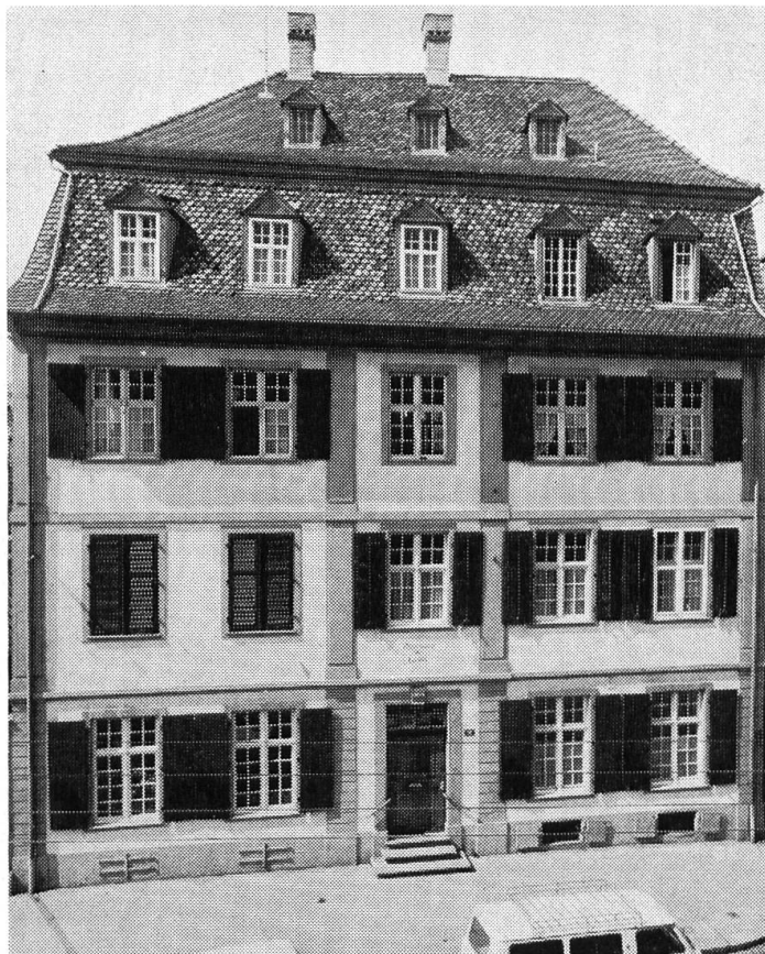
Haus zum Lamm, Rebgasse 16. (Aufnahme: A. Muel- haupt, Basel).

stand ging der Mut zu einem Umbau verloren. Die zum Teil reiche Innenausstattung beider Gebäulichkeiten wurde vor Abbruch noch sichergestellt. Ungleich schwerere Gefährdungen erwachsen für den Nadelberg aber aus zwei grossen, für Universitätszwecke bestimmten Neubauprojekten: ein auf dem Gartenareal des Rosshofs zu hoch geplantes Seminargebäude sowie — im direkten Gegenüber von Schönem Haus und Schönem Hof und Zerkindenhof — ein sich gleichförmig auf über 50 Meter Länge erstreckender neuer Bau des Pharmazeutischen Instituts. Beide Begehren mussten in der eingereichten Fassung abgelehnt werden, zurzeit ist man um Programm-Reduktionen bemüht.