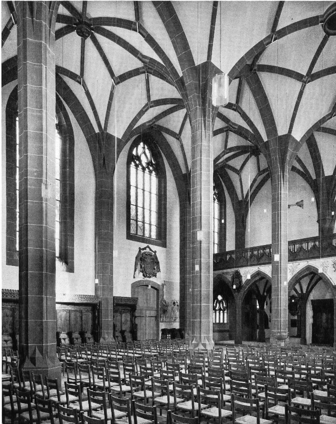
Leonhardskirche. Blick gegen Lettner und rekonstruiertes mittleres Nordfenster über Eingangsportal. Nach Restaurierung 1968.