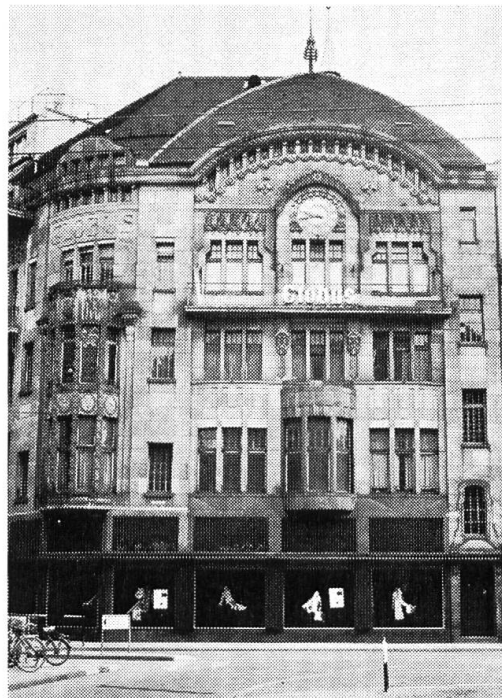
Kaufhaus Marktplatz 1. Architekten Wilhelm Bernoulli und Alfred Romang 1904.

La Roche 1906 erbaut. Die Baumassen der stark bewegten Silhouette sind sehr gut verteilt, die Merkurgruppe des früheren Bahnhofes von Ludwig Maring wurde geschickt eingegliedert. Die neuen Bildhauerarbeiten stammen von August Heer.