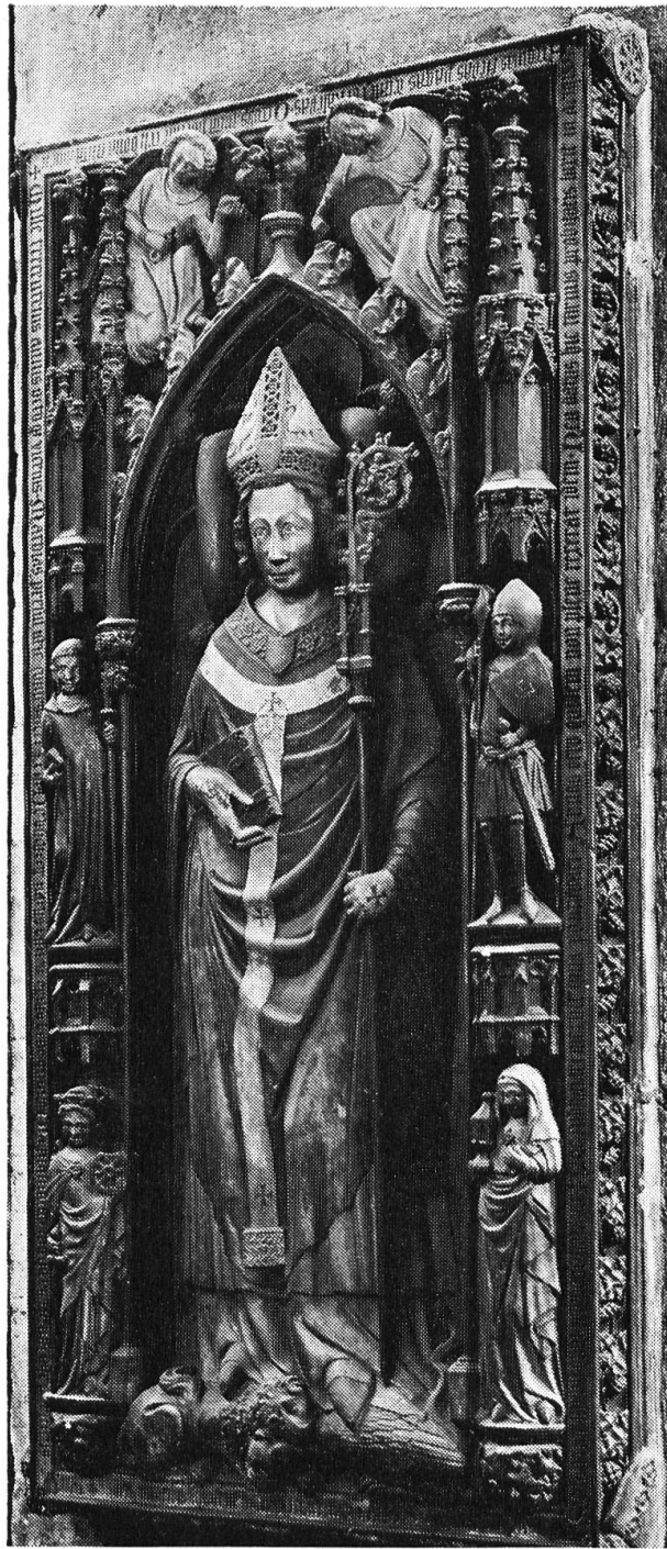
Grabdenkmal für Erzbischof Matthias von Buchegg † 1328 im Dom von Mainz

Erst 1337, wohl 75jährig oder mehr, kehrte Graf Hugo von Buchegg endgültig in die Heimat zurück. Zweifellos mehr aus politischen und praktischen Gründen entschloss er sich in diesem Greisenalter noch zu einer zweiten Hei-