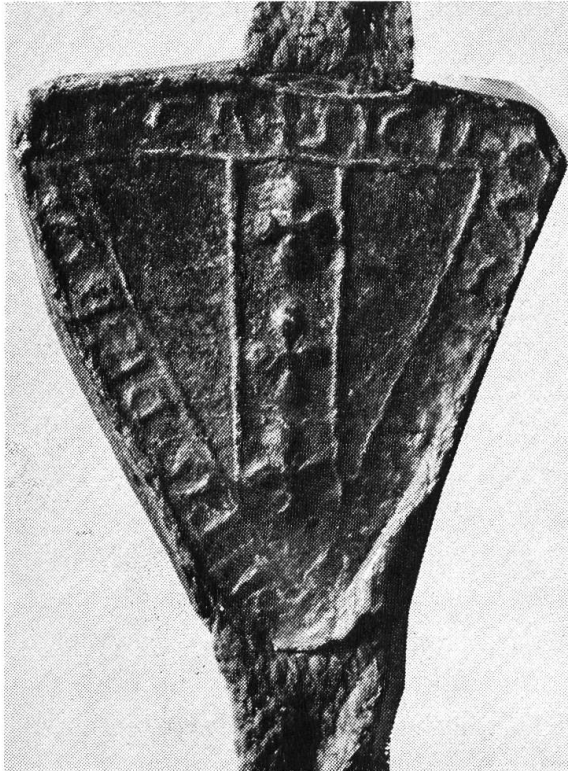
Siegel Peters von Buchegg

St. A. Bern Fach Fraubrunnen 1257 XII. 28. — Siegelbeschreibung: Sol. UB. Bd. 2, S. 85 Nr. 141. — Siegelab- bildung: Sol. UB. Bd. 2, S. 397 Nr. 12.