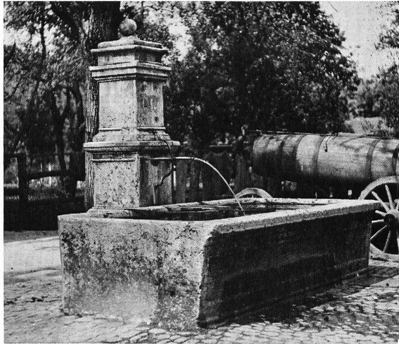
5 Muttenz, Brunnen an der Baselgasse

beherrscht. Eine Maske und eine (neuere?) Kelchform zieren den klassizistischen Stock, — vom Anfang des 19. Jahrhunderts, von 1810.