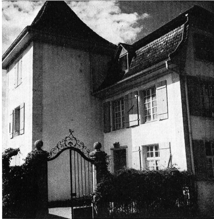
Schlösschen Unteres Emmenholz, Nordostseite mit Gartentor.

beschiedene Ebene. Gepflegte Gartenanlagen und Wasserspiele waren einst dem vornehmen Landsitz vorgelagert. Das Landhaus lag im Mittelpunkt von sternförmig zustrebenden Alleen, von denen noch jene am Emmenholzweg erhalten ist. Zwei hübsche schmiedeiserne Balkone zieren die beiden mittlern Turmfenster, und niedere Gitter schmücken auch die Fenster des mittleren Teiles. Auf der Nordseite ladet ein zierliches schmiedeisernes Gartentor zum Eingang in den traditionsreichen Patriziersitz ein. Daneben erinnert ein schön profilierter Brunnenstock aus dem 17. Jahrhundert an die glanzvolle Zeit der Erbauer.