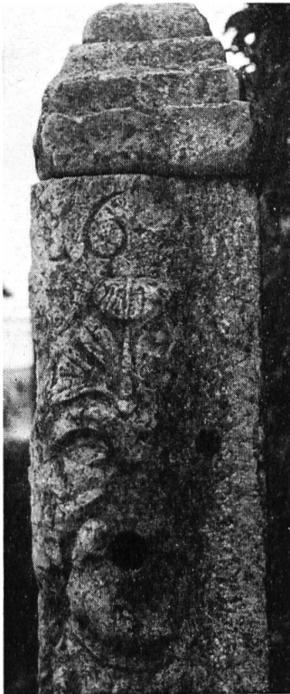
Schlösschen Unteres Emmenholz, alter Brunnenstock.