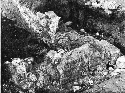
Ausgrabung des Wasserschlossens Emmenholz, Südostecke.

gängern als lebendige historische Erinnerung vor Augen gestellt werden. In dieser von Wassergräben umschlossenen kleinen Burg verbrachte die gute burgundische Königin Bertha um die Mitte des 10. Jahrhunderts nach der Überlieferung schöne Sommertage, wenn sie die königliche Pfalz bei der Stephanskirche auf dem Friedhofplatz besuchte und im Lande herum die Frauen das Spinnen lehrte. Das Schösschen diente den dortigen Landbesitzern als Behausung, den Edlen von Durrach , der aus dem fürstbischöflichen Jura stammenden Schultheissenfamilie von Spiegelberg und ihren Nachfolgern, den Ratsherrengeschlechtern von Roll von Emmenholz. Auf dem Plan von Melchior Erb, Feldmesser, von 1713 ist das Schösschen noch vollständig eingezeichnet. Auf der Darstellung von Oberst Joh. Baptist Altermatt von 1822 ist es als Ruine festgehalten. Durch die jüngste Ausgrabung gab nur mehr der aufgebrochene Rasen Kunde von der einstigen Herrlichkeit.