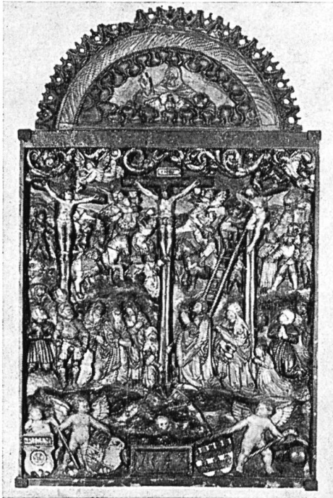
Kalvarienberg, Holzrelief in der Kirche zu Kreuzen.