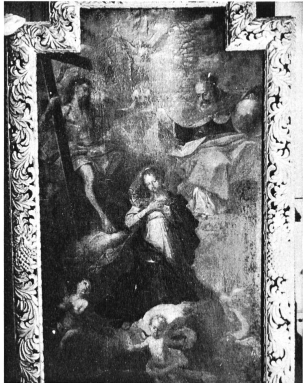
Krönung Mariens, von Franz Karl Stauder 1708. (Foto: Kant. Denkmalpflege)

als frühesten Grundherrn und Inhaber des Kirchensatzes von Zuchwil bezahlt werden.