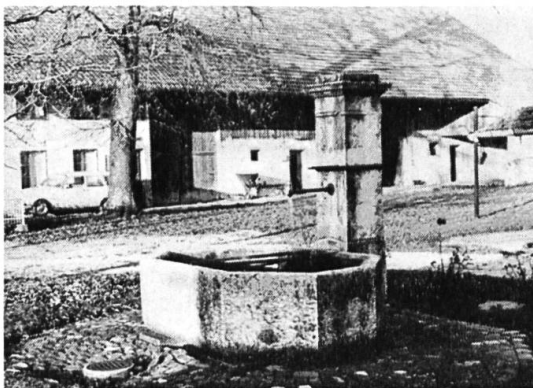
Unteres Emmenholz, Hofbrunnen mit Bauernhaus.

Die weite, sonnige Grünfläche des Emmenholzes und die neuangelegten Wanderwege sind eine Quelle der Freude und Erholung für die volks- und industriereiche Region, und seine lange, in graue Zeiten zurückgreifende Geschichte ist eine Fundgrube lebendiger Überlieferung.