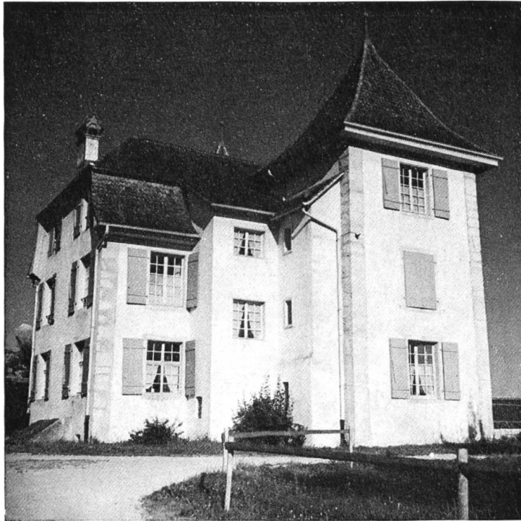
Schlösschen Unteres Emmenholz, Westseite.