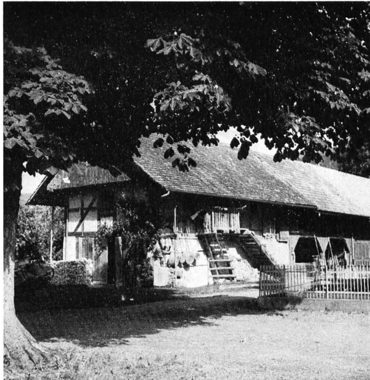
Unteres Emmenholz, Speicher mit Scheunenanbau Südostseite.

Zum untern Hof wurden noch von den oben erwähnten Besitzern ein Landstück von 46 Jucharten und Grundstücke wie Oberholz, Zelgli (Kaisereinschlag) und Widistück mit 22 Jucharten erworben, und auch später erfolgten noch Zukäufe.