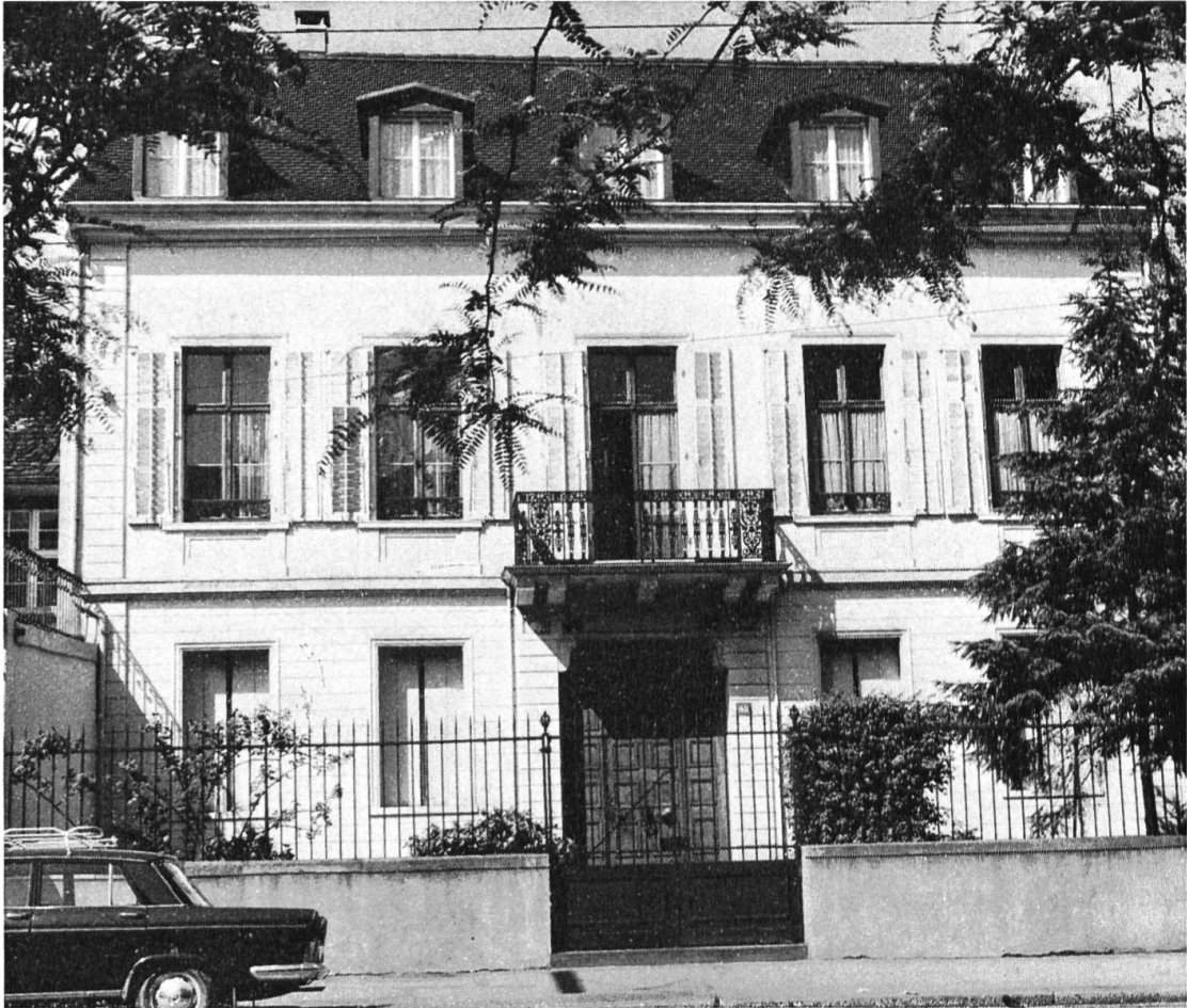
Leonhardsgraben 45