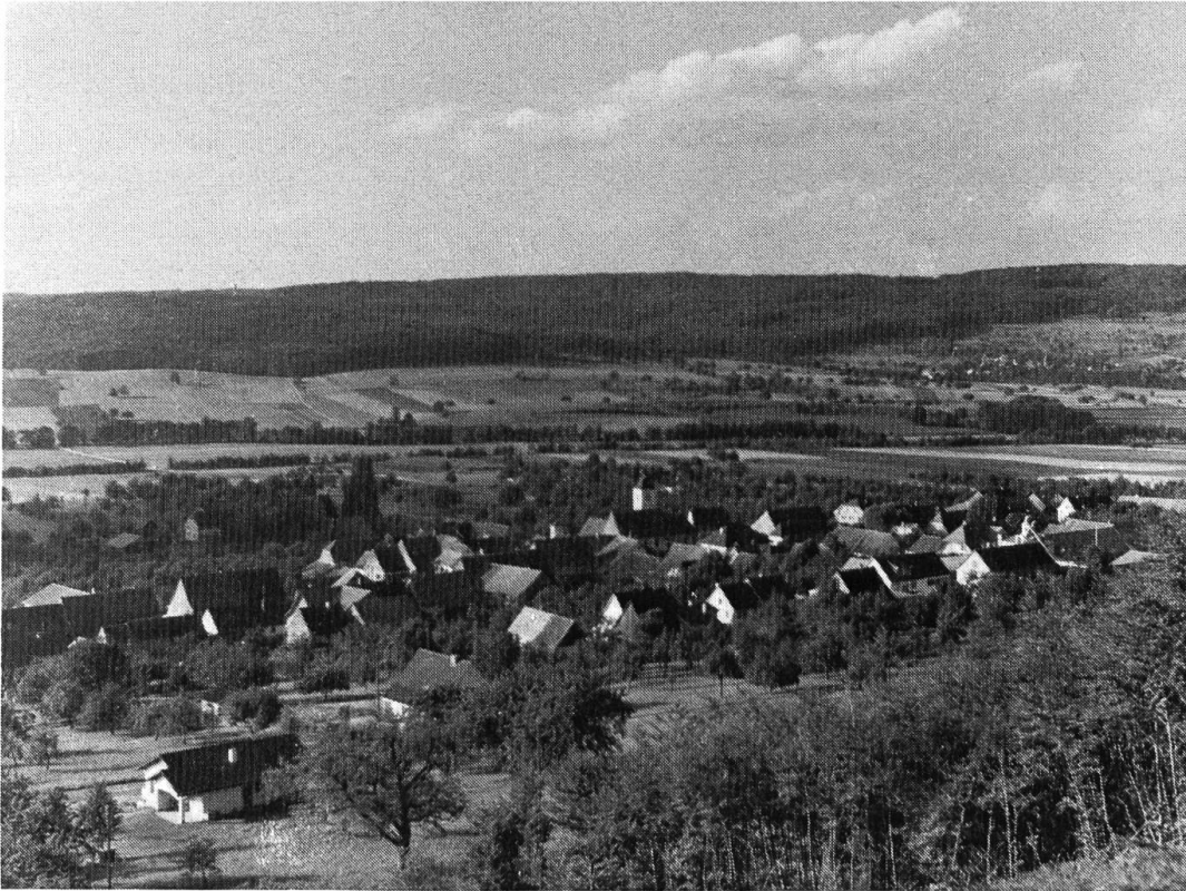
Dorfansicht gegen Liebenswiler