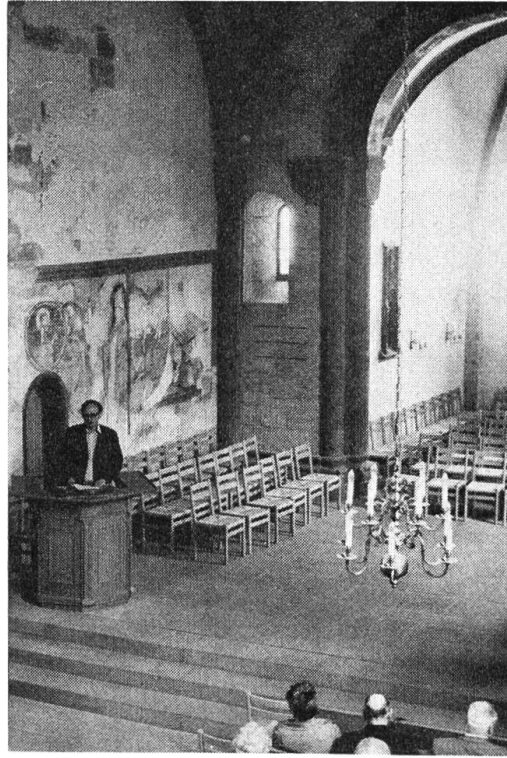
St.-Arbogast-Kirche MuttENZ: Blick in den Ostteil: Kirchenschiff mit Kanzel, Chor, Wandpfeiler mit vorspringenden Halbsäulen, Kreuzrippe, hinter dem Vortragenden Fresken.

liche Feudalburgen entstanden, die für den Berggrat namensgebend waren. Wie der Tagesreferent, der basellandschaftliche Denkmalpfleger Dr. Heyer , ausführte, ist unter diesem Gesichtspunkt auch die Befestigung der MuttENZer St.-Arbogast-Kirche zu verstehen: Der mit einem Zinnenkranz und zwei Tortürmen bewehrte 7 m hohe Mauerring wurde jedenfalls errichtet, als die Wartenbergburgen ihrer Funktion, ausser Sitzen des Adels auch Zufluchtstätten der Dorfbevölkerung zu sein, nicht mehr genügten. — Die Grabungen im Kirchengelände förderten viel Überraschendes zutage: Römische und jüngere Spuren liessen auf eine frühchristliche Kirche schliessen. Über ihren spärlichen Resten erhob sich ein romanischer Bau, dessen Westteil im Erdbeben vom St.-Lukas-Tag 1356 in Trümmer fiel. Sein Ostteil, ein längsrechteckiger Viereckchor, blieb erhalten. Er weist ähnliche Bauelemente auf, wie der romanische Teil des Basler Münsters, ohne dass die gleichen Bauleute durch Steinmetzzeichen bestätigt werden. Seine Decke wird von einem Kreuzrippengewölbe getragen. An einem Medaillon ist das Wappen der Münch-Löwenburg zu erkennen, an anderer Stelle das Allianzwapen der Münch-Eptingen. Diese Dekors erinnern daran, dass die Herrschaft MuttENZ, ursprünglich ein Teil des Elsass', später an die Münch überging, die sie mit ihren übrigen Gütern vereinigten. Einer der letzten des Geschlechts, Hans Thüring, liess den Glockenturm am Nordostteil des Schiffs errichten, bekrönt mit einem Satteldach (einer «Käsbiisse»).