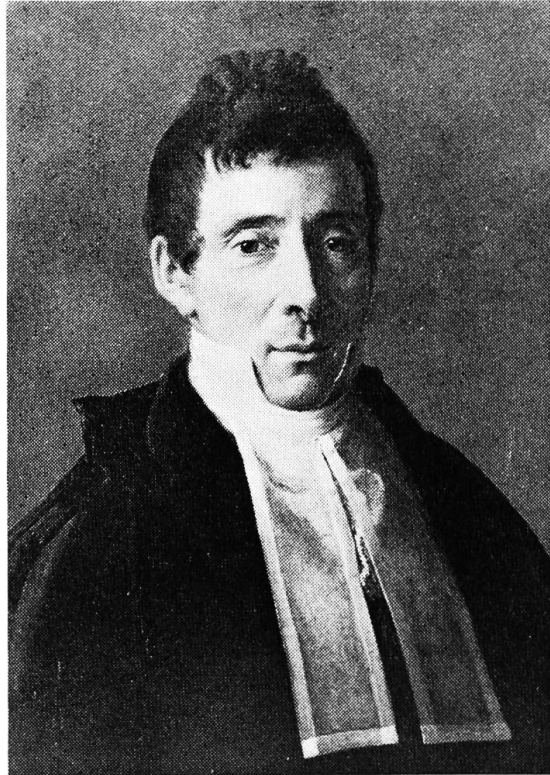
Ludwig von Roll 1771—1839, Staatsrat, Gründer der Eisenwerke (Foto Zentralbibliothek Solothurn).

Noch neigte der Bischof mehr zu Pruntrut. Die betonte Absicht von Solothurn, den Bischofssitz zu erhalten, brachte ihn in Verlegenheit. Eher unangenehm berührt schreibt er an Baron de Billieux, Solothurn suche mit dem Angebot aller möglichen Offerten die Residenz des Bischofs in seine Stadt zu bringen in der Absicht, sein Stiftskapitel in ein Domkapitel umzuwandeln. Bern unterstütze diese Lösung, weil es damit weniger Kosten zu leisten habe. Zwei Gegner seien also zu bekämpfen, jener, der den Namen «Bistum Basel» zum Verschwinden bringen möchte 10 , und Solothurn, das den Bischofssitz beanspruche. Er rechnete noch immer mit einer Umstimmung Berns. Wenn dieses sich zur Leistung der Dotation bereit finde, dann falle es leicht, die Probleme zu lösen; auch Solothurn habe dann nicht mehr die gleichen Gründe, die Residenz des Bischofs erlangen zu wollen. Der Bischof sicherte de Billieux zu, sich weiterhin für Pruntrut einzusetzen. Er empfahl aber auch, dass die Kreise im Fürstbistum sich mit seinen Bemühungen verbänden, um die Sicherung der Bistumskosten von Bern zu erlangen.