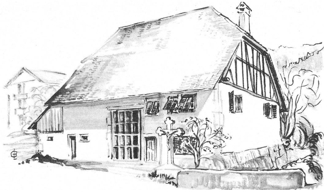
Bettlach: Ehemalige Zehntenscheune. Einst Abbruchobjekt, jetzt in ein kulturelles Zentrum umgewandelt. Auch der HS fehlte nicht — war dabei.

stunde, an die tausend Schritte messende Meile, an ein Tagwerk Ackers, an einen Morgen Land . . . Immer wieder zeigt sich eindrücklich dasselbe: gemessen wurde von Menschen.