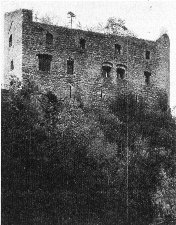
Ruine Gilgenberg von Süden.

doch, das Wahrzeichen Gilgenbergs für kommende Generationen zu erhalten. Alle, die dazu die Initiative ergriffen haben, verdienen heute schon einen Dank.