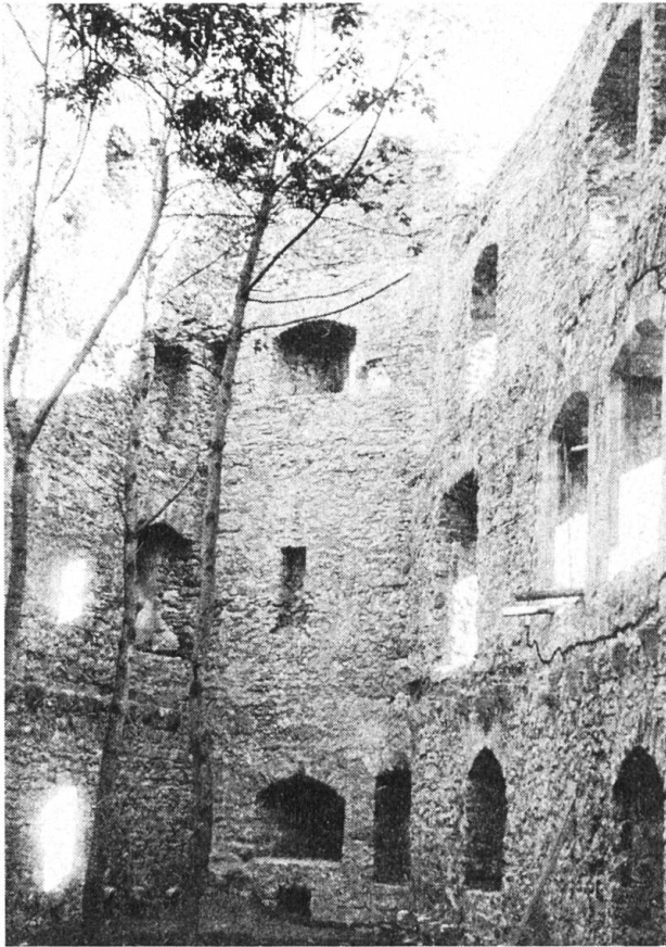
Ruine Gilgenberg, Konservierungsarbeiten 1930.

goldswil, der Berg Kastel, der «Hoff Rottris» und der «Hoff Ferren». Der Kaufpreis machte 5900 Gulden. Erster solothurnischer Vogt war Ulrich Küffer. Hans Imer machte im Kaufvertrag zur Bedingung, dass die Bevölkerung des Gilgenbergs immer gut behandelt werde.