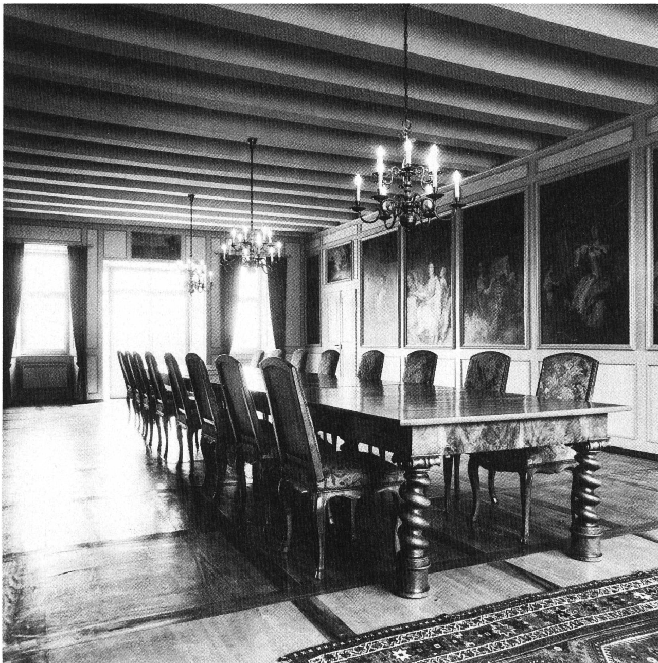
Gartensaal mit Musenzzyklus.