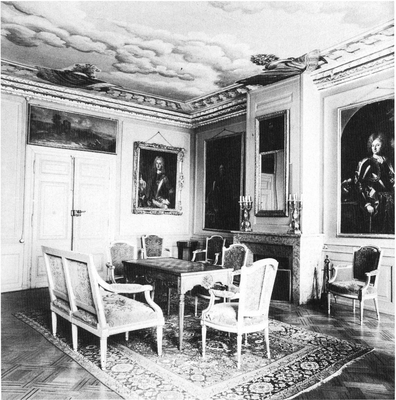
Salon Louis XVI mit Porträts aus der Familie Besenval.

Warschau im Januar 1722 durch Marcel Delauney, und ein mächtiger Barockschränk mit gedrehten Säulen und plastischer Kassetierung der Türen und des Sockels, aus der 2. Hälfte des 17. Jahrhunderts, vielleicht ein Baslerstück.