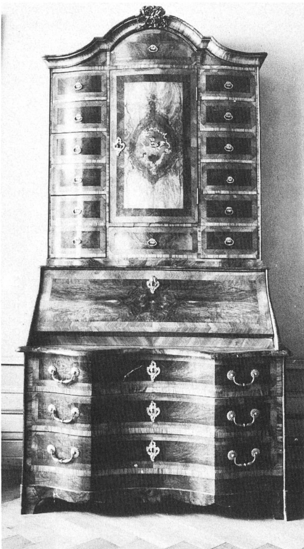
Trois corps mit eingelegtem Blarer-Wappen im Salon Louis XV.

Kostbar ist auch die stattliche Serie von zehn Régence-Fauteuils mit Jonc-Geflecht, ebenso ein zierliches achtfüssiges Canapé derselben Zeit. Zwischen den Fenstern steht ein reich geschnitzter und vergoldeter Konsoltisch mit Oberhasli-Marmorplatte, und darüber hängt ein grosser Louis XV-Spiegel mit Goldrahmen. Ein Kristall-Leuchter mit üppigem Behang erleuchtet den Raum.