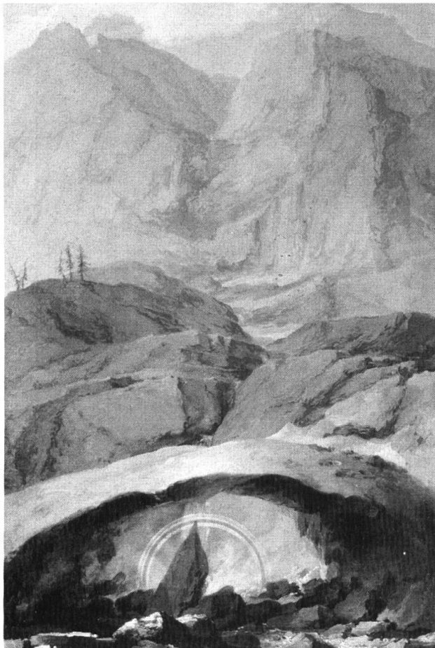
Caspar Wolf: Schneebrücke und Regenbogen im Gadmental. Sign. und dat. «C. Wolf 1778». Öl auf Leinwand, 82 × 54 cm. Basel, Kunstmuseum.

Das künstlerische Hauptgewicht von Wolfs Solothurner Jahren, seiner letzten in der Schweiz verbrachten Zeit, liegt aber — neben dem eingangs zitierten Gemälde «Bärenhöhle» im Solothurner Jura — auf seinen späten Alpenlandschaften für Wagners Galerie in Bern.