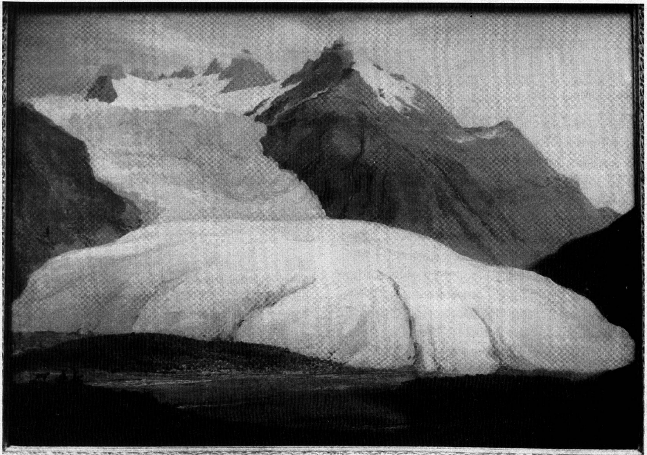
Caspar Wolf: Der Rhonegletscher. Sign. und dat. «Wolf 1778». Öl auf Leinwand, 54 × 76 cm. Aarau, Kunsthaus.

schon von dieser Gegend aus den Finsteraargletscher aufgenommen hatte, 1777 hier sein 1775 oder 1776 vorbereitetes Gemälde mit dem «Lauteraargletscher» (Aarau, Kunsthaus; Wiederholung im Kunstmuseum Basel; Ölstudie dazu in Berner Privatbesitz) den letzten Ergänzungen unterzog. Spät, um drei Uhr nachmittags, brach man dann zur Rückkehr auf, gelangte über die Südseite des Gletschers zum Zinkenstock, wo die alte Kristallhöhle besichtigt wurde, und erreichte erst nach Einbruch der Nacht wieder das Grimselhospiz. Am 7. August folgten die Wanderer der Grimselstrasse, die damals noch nicht nach Gletsch, sondern nach Obergesteln im Goms führte. Auf der Passhöhe der Grimsel machten sie einen Abstecher dem Totensee entlang, und Wyttensch setzte sich dort, wo der alte Pfad über den jähren Abhang des Meyenwang hinunterführt, um den Rhonegletscher von oben zu bewundern und seine Beobachtungen zu no-