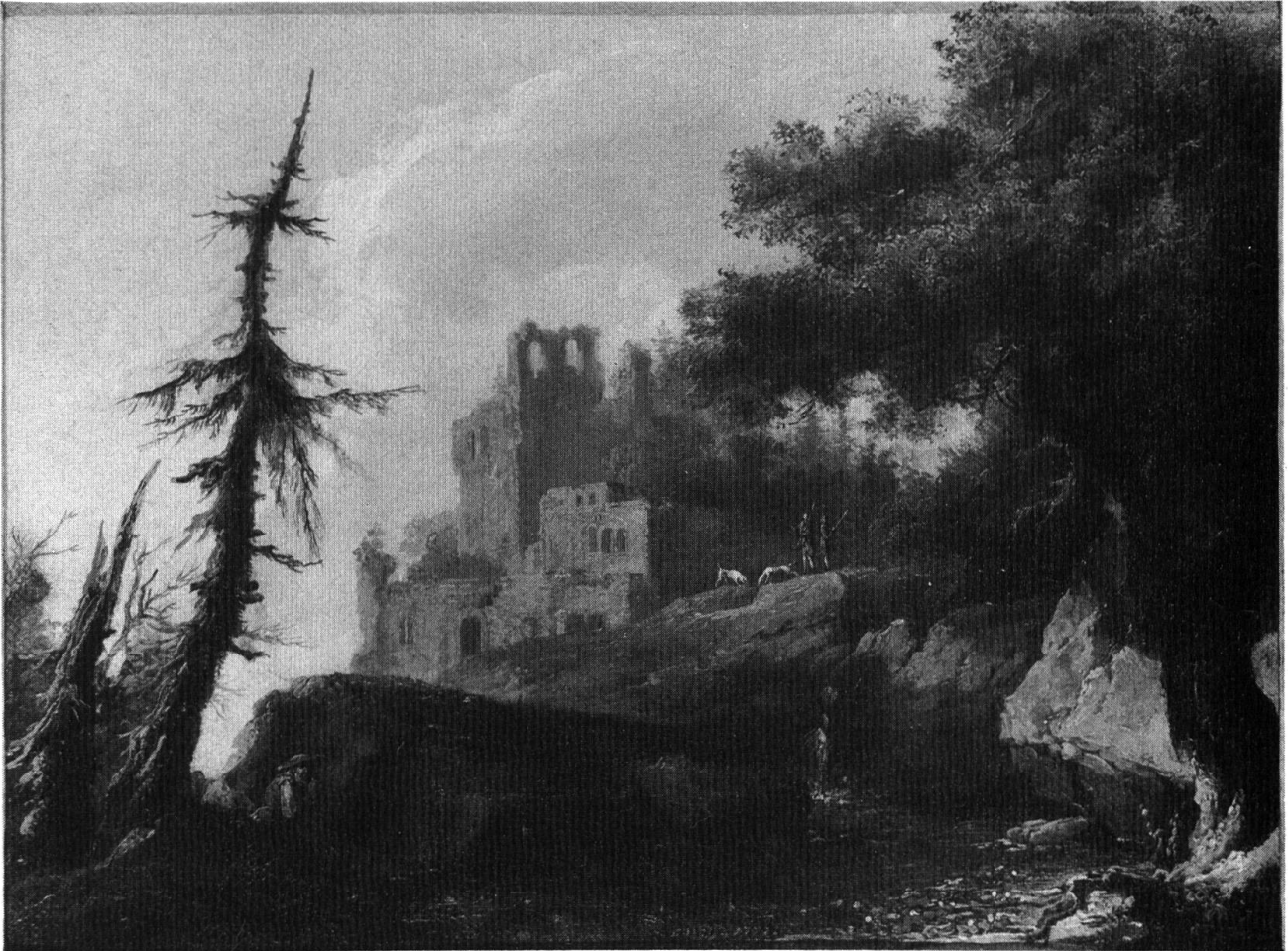
Caspar Wolf: Gebirgssee mit Tanne und Ruine. Sign. und dat. «C. Wolf 1779». Öl auf Leinwand, 31,8 × 42,7 cm. Privatbesitz.

tenfolge») und dazu mehrere Einzelblätter (u. a. auch das Raeber noch nicht bekannte «Spizenfluhli, pres de Balstal Canton de Soleure», Exemplar in der Zentralbibliothek Solothurn) herausgab, und dass er schliesslich seine alte Übung der komponierten Landschaften wieder aufgenommen hatte. Diese, zum Teil erst in jüngster Zeit entdeckten Phantasielandschaften aus der Zeit von 1777—79 (darunter ein kleines Gemälde mit der einzigen bis jetzt bekannten Datierung «1779») verkauften sich wahrscheinlich leichter als die strengeren Alpengemälde. Und Wolf hatte, seit seinem Wegzug aus Bern, da nun auch der Wagnersche Auftrag am Auslaufen war, alles Interesse, sich eine neue wirtschaftliche Grundlage zu schaffen. Seine Wiederaufnahme der komponierten Landschaften, in denen er stilistisch an seine entsprechenden früheren, vor 1774 entstandenen Arbeiten anknüpfte, könnte darauf