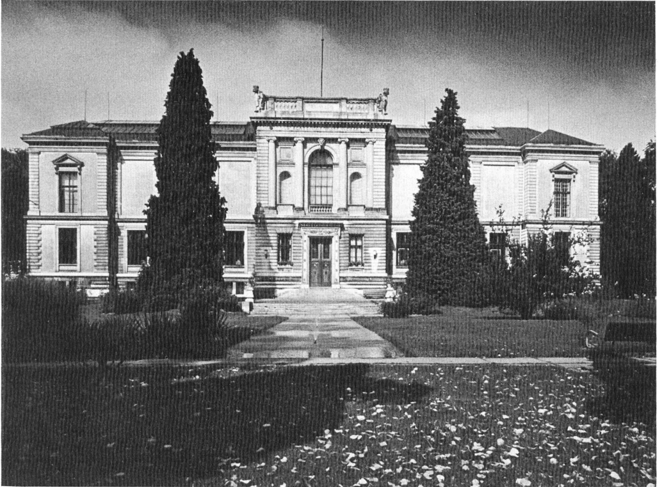
Kunstmuseum Solothurn, Aussenansicht.