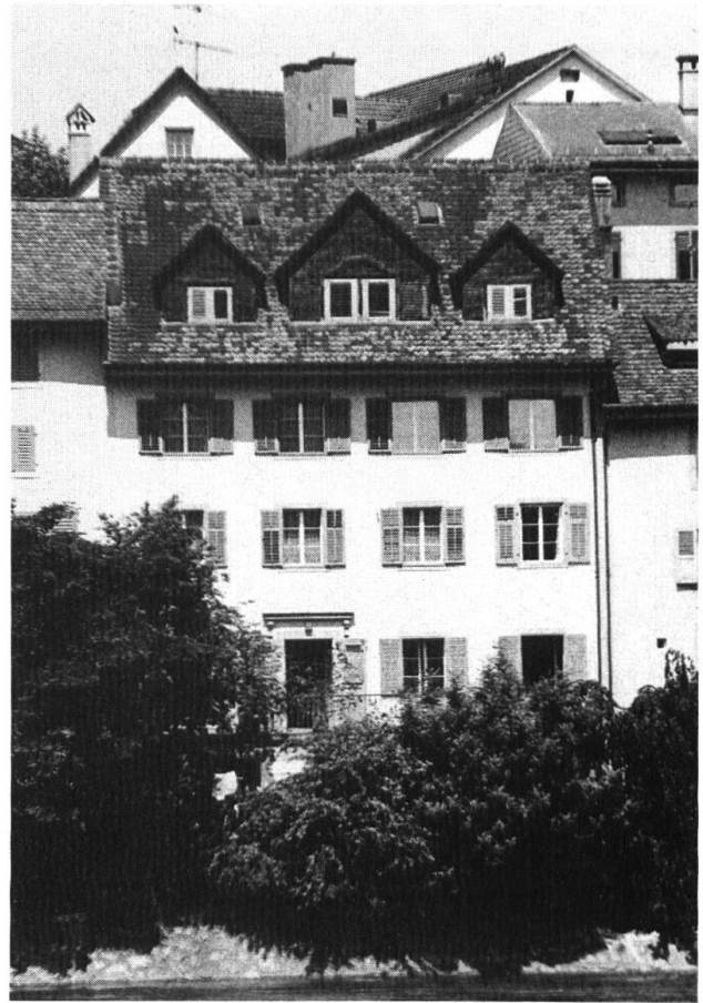
Das erste Schulhaus der Stadt. Aufnahme 1979.

Seit wann aber diente das Frühmesserhaus als Schulhaus? Die Quellen darüber sind spärlich. Dass es in Olten eine Schule gibt, geht erstmals aus den Ausgabenbelegen für das Jahr 1542 hervor, wo ein Posten von 4 Batzen ausgewiesen ist, der den Schülern zu Fronleichnam zustand 8 . Laut einem