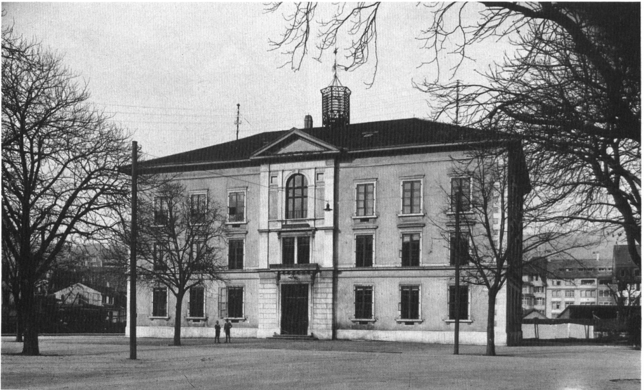
Das Hübelschulhaus. Sitz des General-Hauptquartiers unter General Herzog während des Deutsch-französischen Krieges 1870/71,

scheiben erhielten eine neue Verglasung 16 . Neben der Schulstube, in der zuweilen über 100 Kinder die Schulbank drückten, beherbergte das Schulhaus auch die Lehrerwohnung. Dies solange die Schule durch einen weltlichen Lehrer versehen wurde.