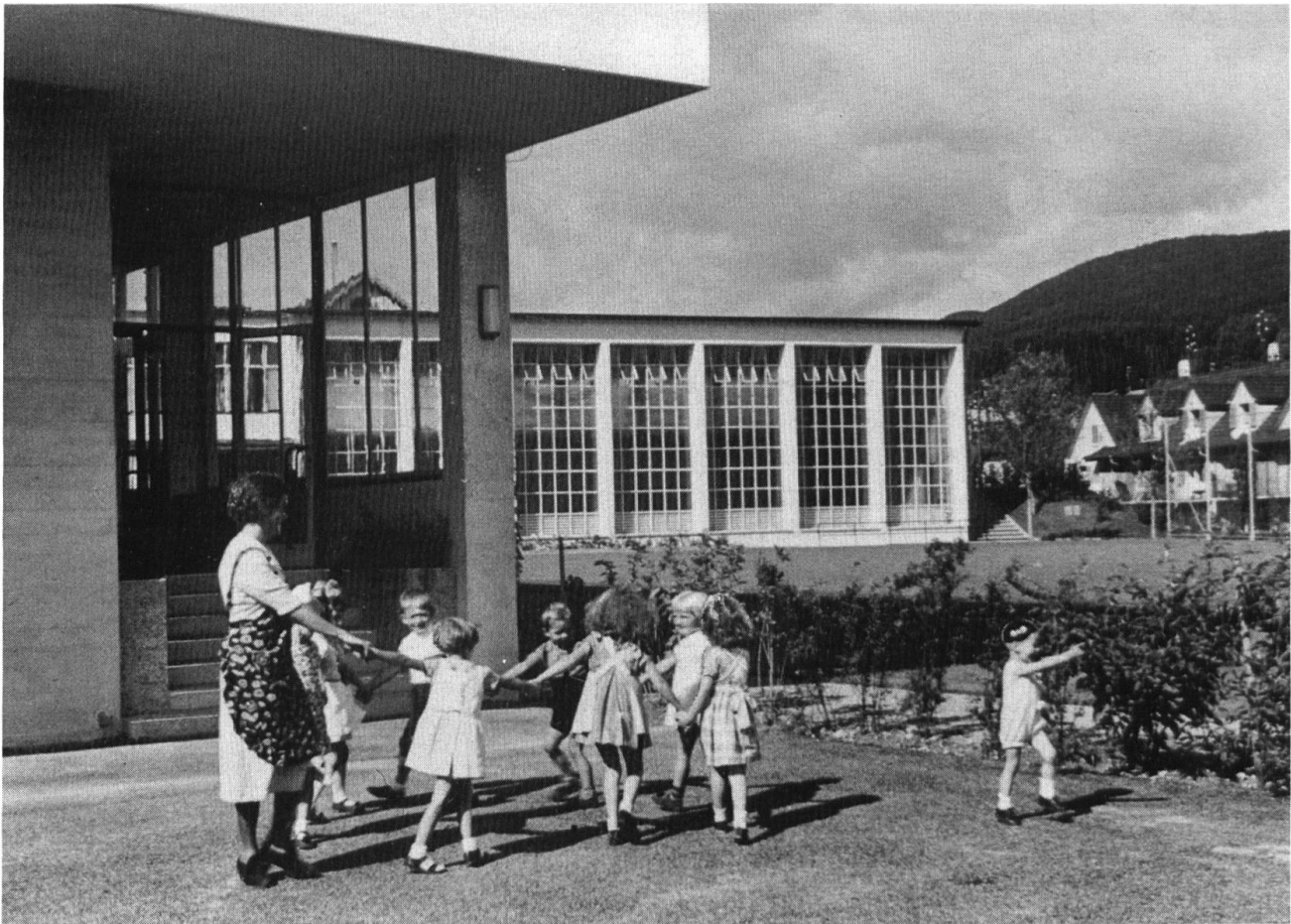
Mit der Kantonsschul-Abteilung im Anbau auf dem Frohheim entstanden im Ostflügel auch zwei Kindergartenlokale. Einweihung 3. September 1938.