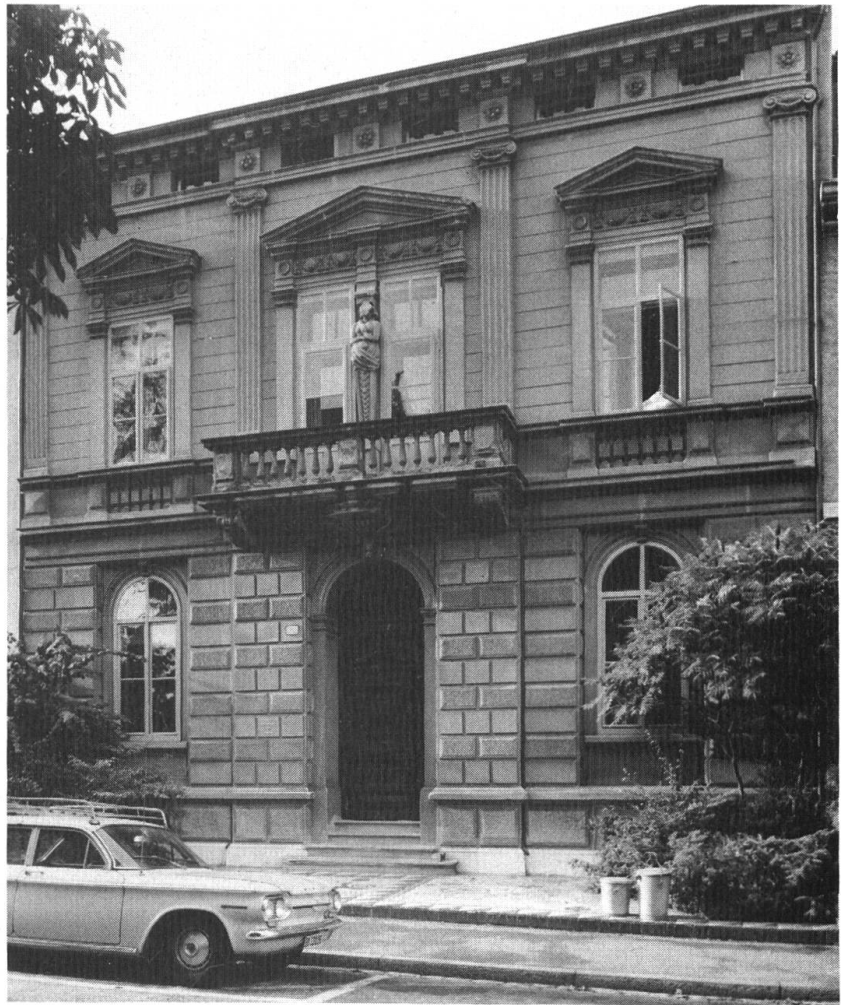
Schertlingasse 16 (aus R. Brönnimann «Basler Bauten 1860—1910». Foto Chr. Teuwen, Basel).

salites, nämlich 5 m! Von der zweiten Boden-, resp. Sockelgurte des ersten Stockes bis zur Konsolenreihe unter dem Dachhimmel beträgt die Höhe 5,20 m. Sie verhält sich zur Breite eines Seitenrisalites genau im Verhältnis des grossen Abschnittes «A» des Goldenen Schnittes zum kleinen «B». Diese Strecke «A» wird durch die ausladende Breite des obersten Kranzgesimses des Mittelrisalites fast erreicht — ein wohlüberlegter Fasadenschnitt! Über dem untersten, hellen Kalkstein-Sockelband erhebt sich in grauem Sandstein, wie die übrige Front, ein zweiter Sockelfries. In der Mitte sind vier Portalstufen eingelassen, wobei die unterste breiter vor der Front liegt. Über den Sockel, über feinen Treppungen, legt sich die breite, plane Bodengurte des Erdgeschosses. Die 88 cm hohen Türsockel stehen auf der zweiten Treppenstufe auf.