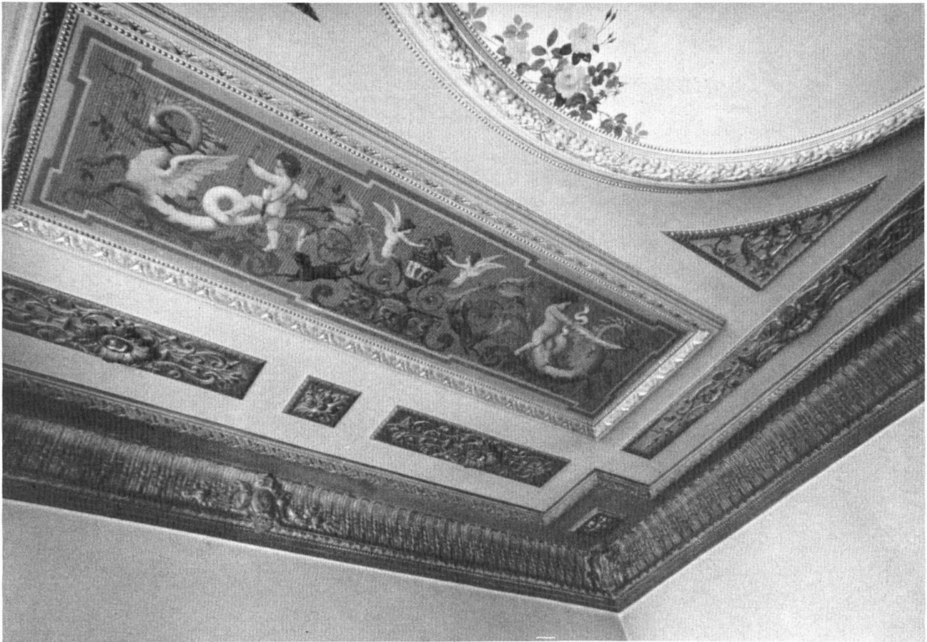
Schertlinggasse 16. Farbige bemalte und teils graudunkelgrün stuckierte Decke im Musiksalon.

kus. Vielleicht aus dem selben Anwesen in der «Dalbe» beim Tor stammt ein schönes, klassizistisches, weisses Marmorcheminée im südwärtigen Vorderzimmer an der Schertlinggasse 16, das Herr Hellinger gerettet hat. Auch dieses Zimmer wird am Boden von kostbarem, hier gar 6farbigem Tafelparkett belegt. Doch die Sterne in den Quadratfeldern sind etwas kleiner gehalten. Ein einfacher Stuckrahmen umzieht die Decke, denen im Erdgeschoss ähnlich. Ähnlich den unteren sind auch die mit Blattwerk verzierten, aufstellbaren Gusseisengriffe, die im ersten Stock vorne die drei Fenster beschlagen.