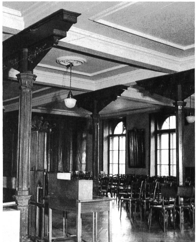
Speisesaal im 1871 erbauten Kurhaus in Langenbruck mit gusseisernen Stützen und Gipsdecken.

In Liestal fand die Restaurierung des alten Zeughauses in der Altstadt ihren Abschluss, indem es gegen Ende Jahr seiner zukünftigen Zweckbestimmung als Kan-