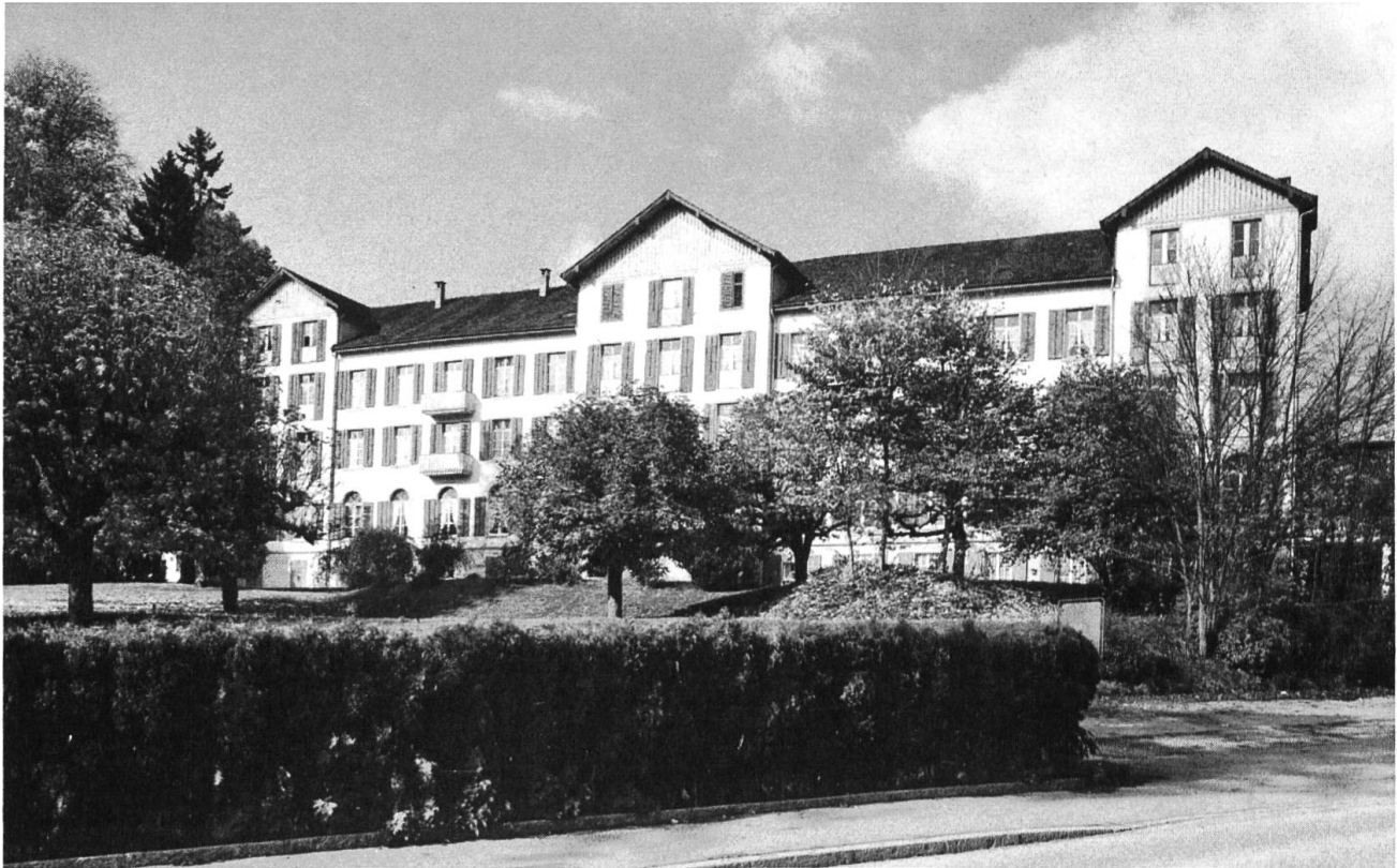
Das 1871 erbaute Kurhaus von Langenbruck mit der bereits stark veränderten Südfassade kurz vor dem Abbruch.

zeichnen sich Veränderungen im Betrieb der alten Papiermühle ab. Die Christoph Merian'sche Stiftung und die Stiftung Papiermühle Basel zeigten vor allem grosses Interesse an der betrieblichen Einrichtung der Papiermühle aus dem 19. Jahrhundert. Zur Untersuchung der industriearchäologischen Aspekte des Betriebes wurde Herr O. Baldinger zugezogen, der ein umfassendes Gutachten über die Einrichtung erstellen wird. Gleichzeitig übernahm Dr. G. Loertscher den Auftrag, ein bauhistorisches Gutachten über die Bedeutung der Mühle als Ensemble zu verfassen. Bereits heute zeichnet sich ab, dass die Papiermühle Lausen dank ihrem Dornröschenschlaf in jeder Beziehung ein ausserordentlich wertvolles Ensemble ist, das in seiner Bedeutung noch nicht erkannt ist.