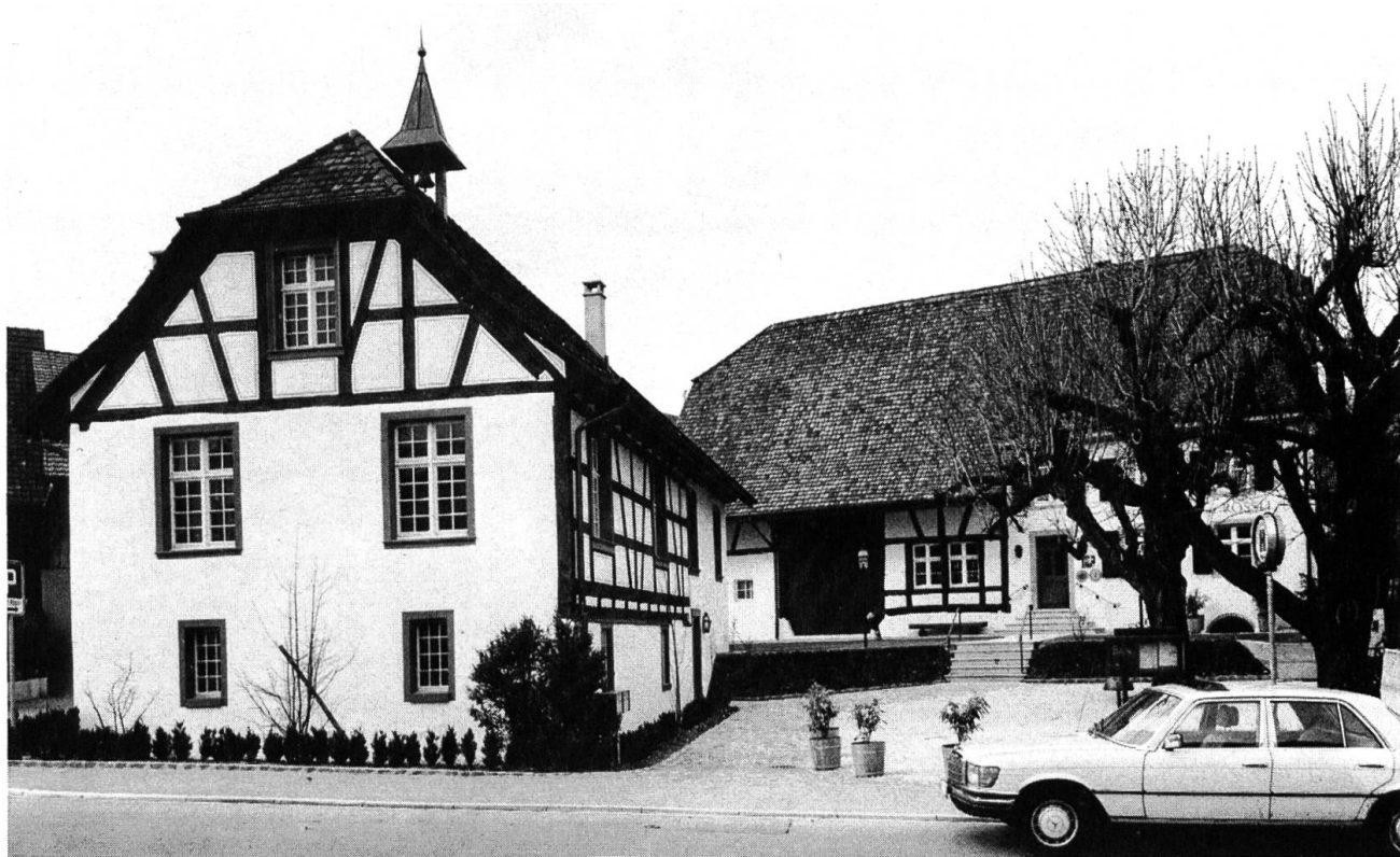
Ehemaliges Spritzenhaus und Gasthaus zum Rössli in Oberwil, beide aus dem 19. Jahrhundert und von der Bürgergemeinde restauriert.

Feiern zum 300-Jahr-Jubiläum des Domes ging die Restaurierung der Domplatzfassaden der Domherrenhäuser 5 und 7, heute Gerichtsgebäude, zu Ende. Ersetzt wurden dabei die Eingangstreppe, während man die Sonnenuhr in den ursprünglichen Farben wieder herstellte. Der Kredit für die Gesamtrestaurierung der beiden Gebäude wurde vom Landrat nach einer ersten Zurückweisung bewilligt. Gegen Ende des Jahres konnte die alte, nunmehr vollständig restaurierte Trotte der Öffentlichkeit übergeben werden. Nachdem sie lange Zeit den Wegmachern gedient hatte, soll sie nun zur Aktivierung des Dorflebens beitragen. Dank der Unterkellerung gewann man im Erdgeschoss einen grossen Raum für Ausstellungen, Konzerte oder gesellige Anlässe. Das Dachgeschoss wird die Sammlungen des Heimatmuseums