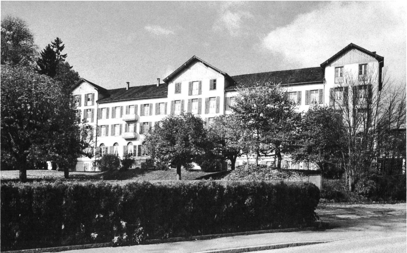
Das 1871 erbaute Kurhaus von Langenbruck mit der bereits stark veränderten Südfassade kurz vor dem Abbruch.