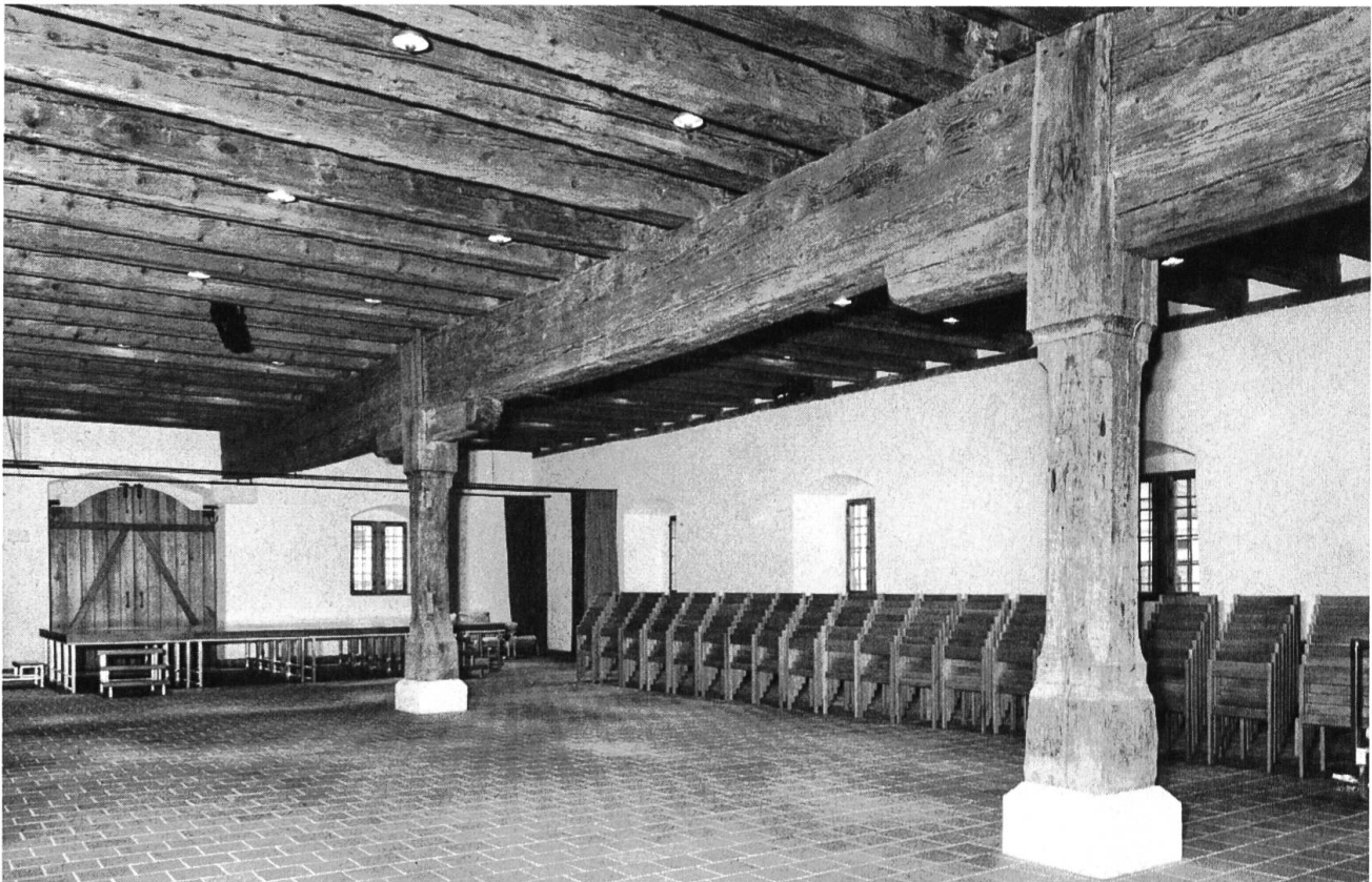
Erdgeschoss des ehemaligen Zeughauses in Liestal, heute Kantonsmuseum mit mächtigen Balken und Holzstützen.

zu genügen, präsentiert es sich aussen zusammen mit dem ehemaligen Pächterhaus wieder wie früher. Jedenfalls hat es sich gelohnt, dass die Heimatschutzkommission an der Erhaltung des Pächterhauses, das sehr baufällig war, festhielt. Eine Tafel neben dem Eingang erinnert daran, dass hier die ersten Versammlungen zur Gründung des Kantons Basel-Landschaft stattfanden. Nicht umsonst wird das Bad Bubendorf im Zusammenhang mit der 150-Jahrfeier des Kantons als Baselbieter Rütli bezeichnet. Vor wenigen Jahren war es im Besitze der Kantonalbank, die daran kein Interesse mehr zeigte und es dem Kanton anbot. Als dieser das Angebot ausschlug, ging es an