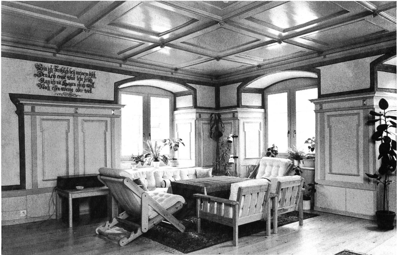
Stube im Obergeschoss des 1671 erbauten Neuhauses in Hölstein mit Holztäfer und -decke sowie Wandspruch aus der Erbauungszeit.

einen Privatmann, der sich der Geschichte und der Bedeutung des Gebäudes bei der Entstehung des Kantons voll bewusst ist.