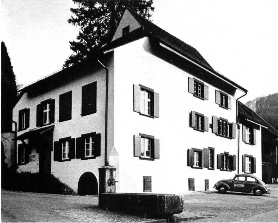
Das Pfarrhaus von Tenniken mit dem dreigeschossigen Kernbau von 1559, dem Pultdachanbau aus dem 17. und dem zweigeschossigen Südteil aus dem 19. Jahrhundert.

Alle Unterschutzstellungen erfolgten auf freiwilliger Basis mit Zustimmung der Eigentümer. Vom Abbruch bedroht war einzig ein Bauernhaus am Friedhofweg 7 in Füllinsdorf. Seine Substanz konnte durch die Gemeinde aufgrund eines mit dem Eigentümer ausgehandelten Vertrages gesichert werden, doch fehlt noch der Wille des Eigentümers zur Sanierung. Mit bereits zwei Gutachten wollte er nachweisen, dass das Haus nicht mehr erhalten werden kann. — Nicht unbedingt als Verlust ist der Abbruch des 1871 erbauten Kurhauses in Langenbruck zu bezeichnen, war doch dieses Gebäude trotz seiner markanten Stellung am Dorfeingang architektonisch nicht besonders wertvoll. Die vier im Foyer in die Wände eingelassenen Rundbilder in Öl auf Leinwand, gemalt von dem damals bekannten Kunstmaler Arnold Jenny, mit Landschaftsdarstellungen konnten erworben und abgenommen werden.